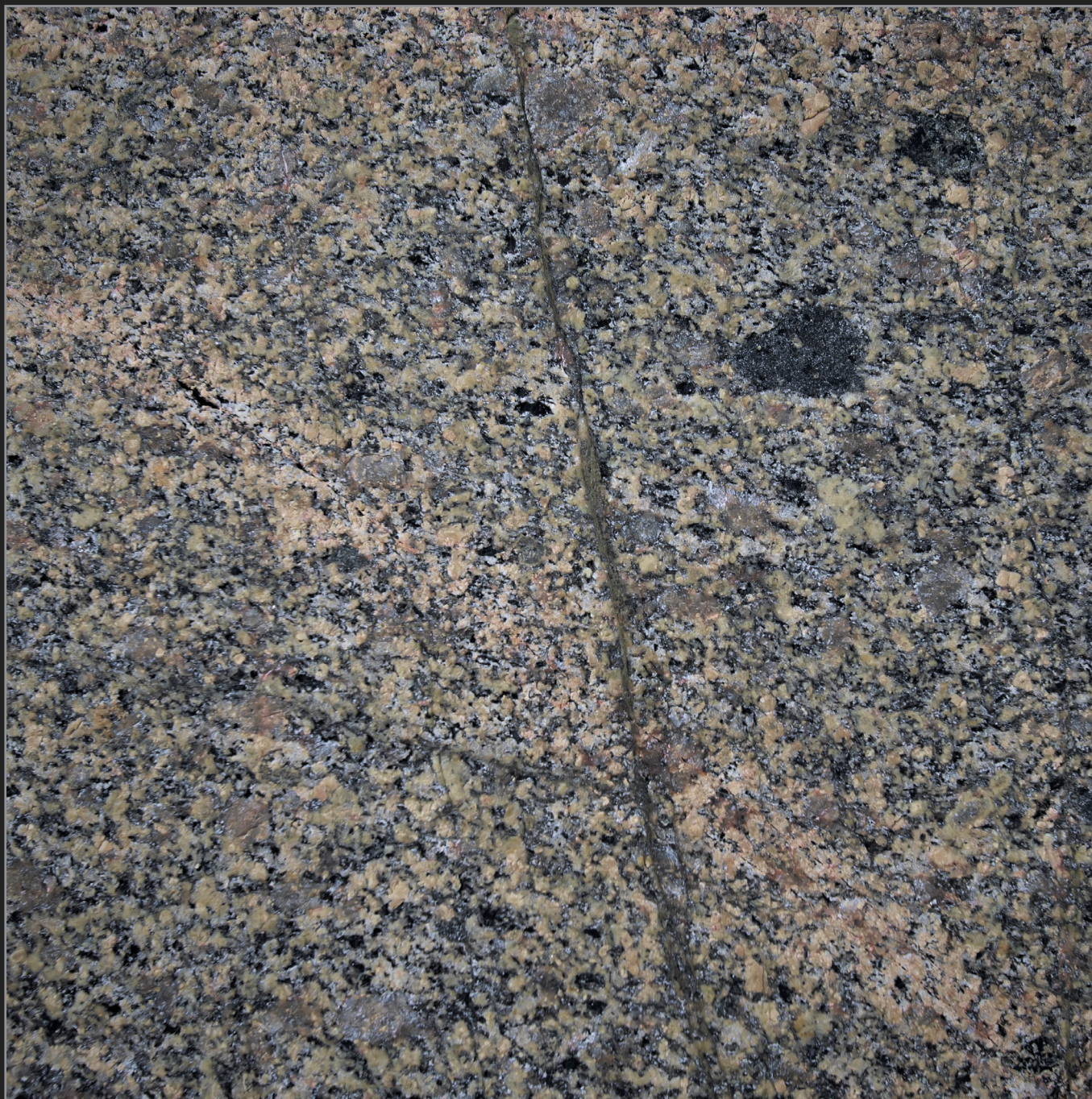
Qaqortoq, Sydgrønland, maj 2017