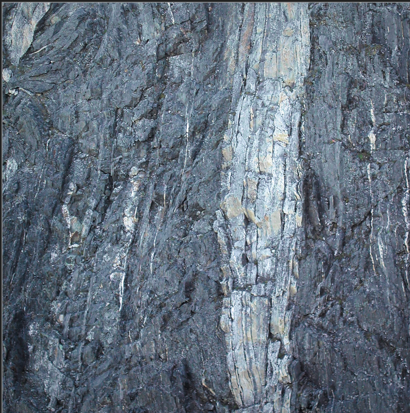
Nuuk, Vestgrønland, august 2003