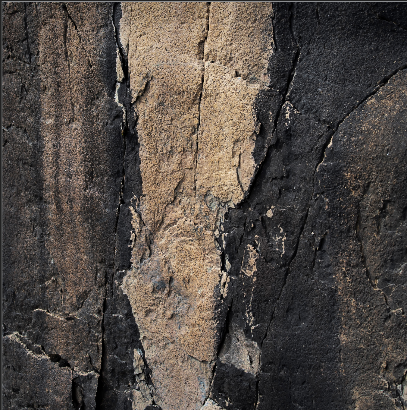
Qaqortoq, Sydgrønland, august 2015