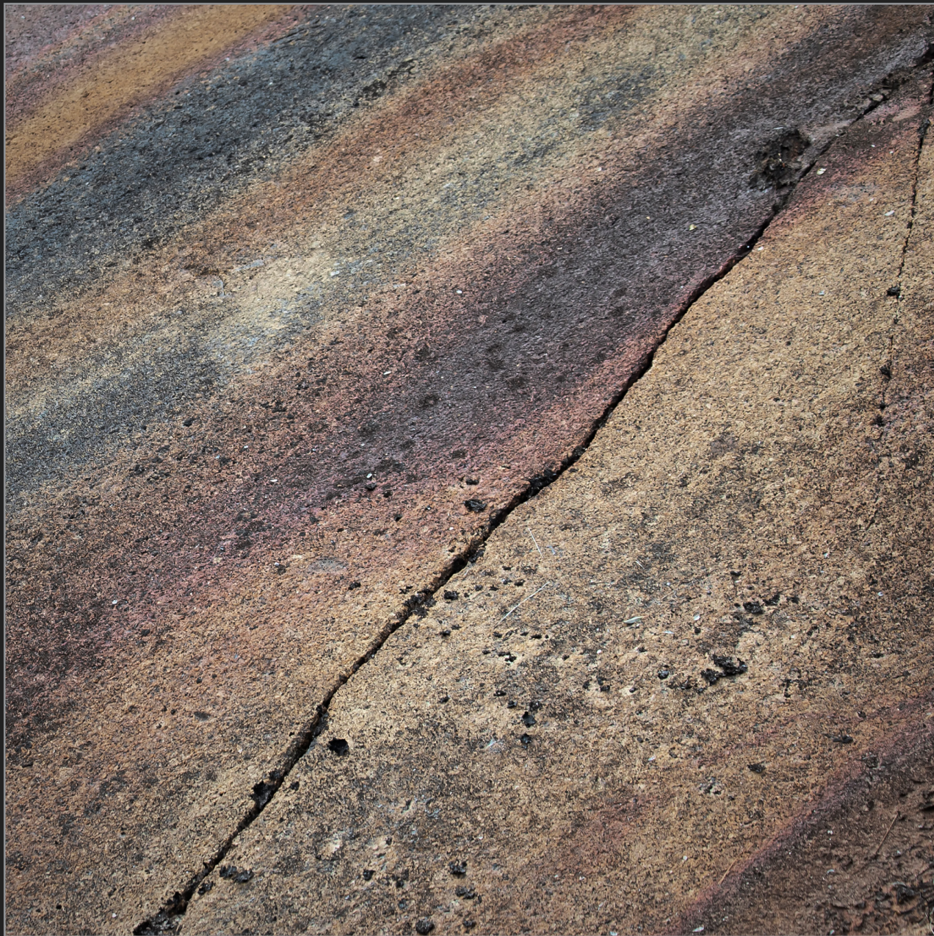
Qaqortoq, Sydgrønland, august 2015