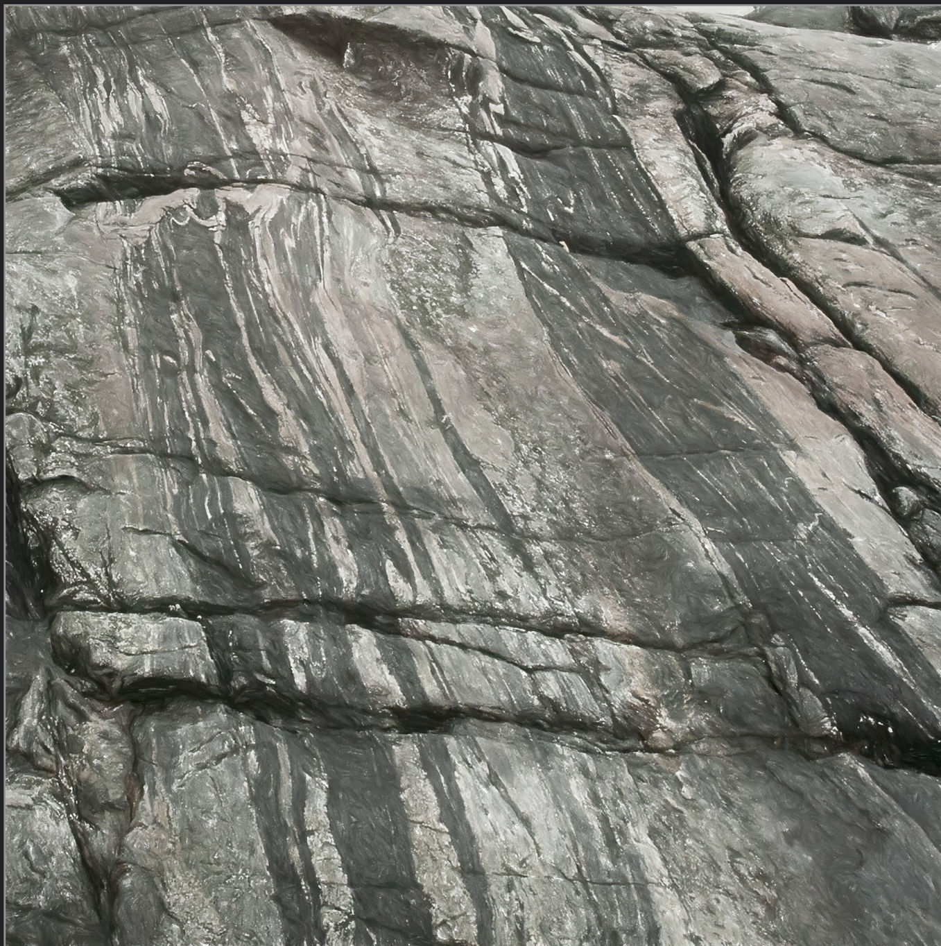
Nuuk, Vestgrønland, marts 2006