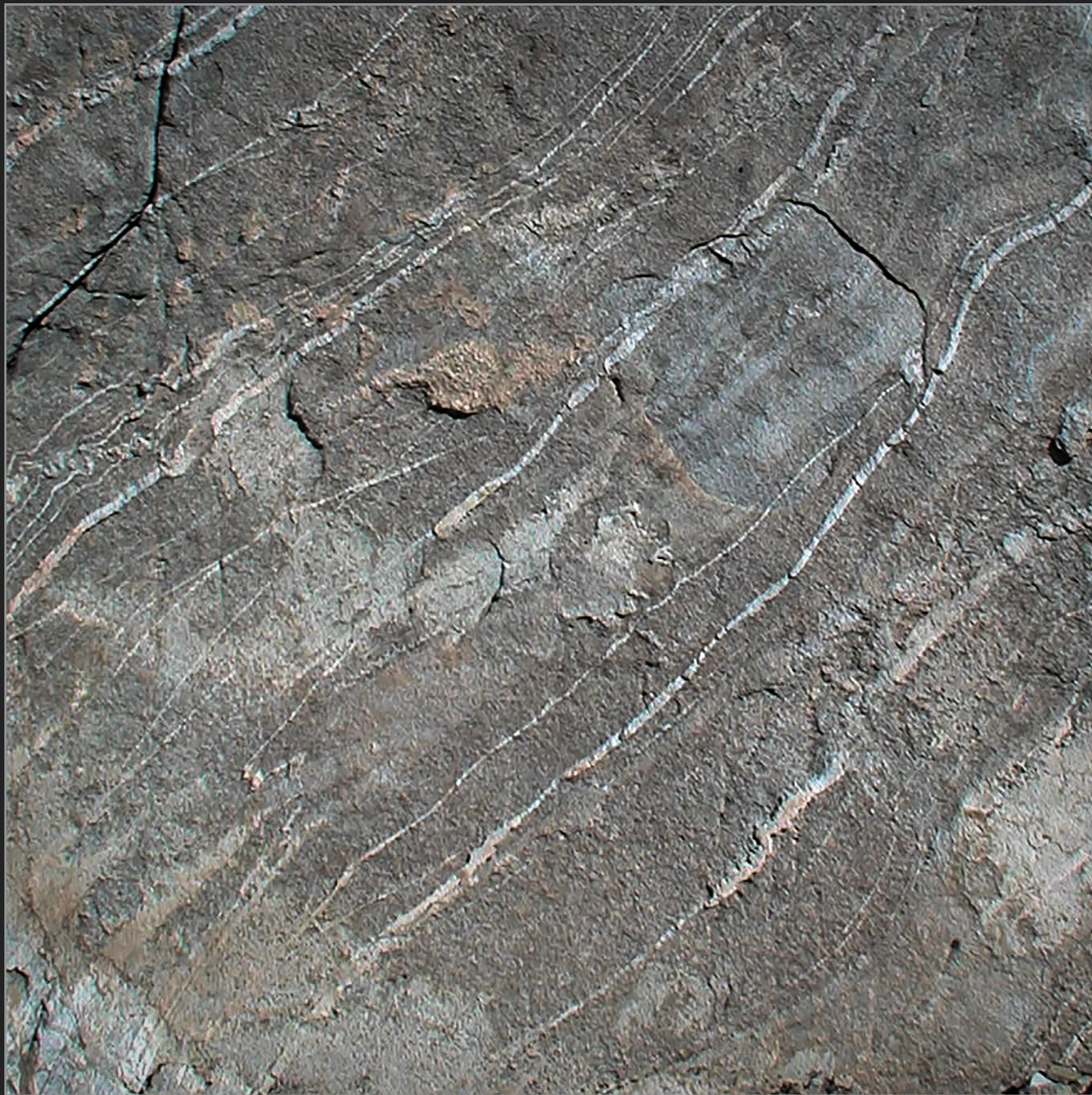
Nuuk, Vestgrønland, august 2003