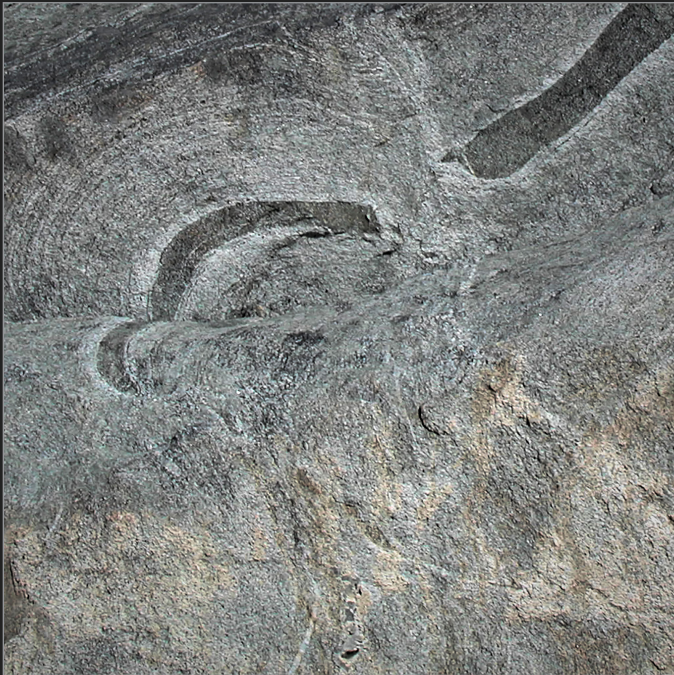
Nuuk, Vestgrønland, august 2003