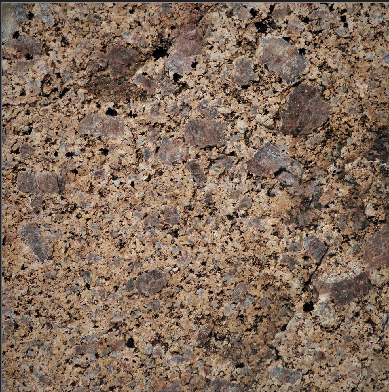
Qaqortoq, Sydgrønland, august 2015