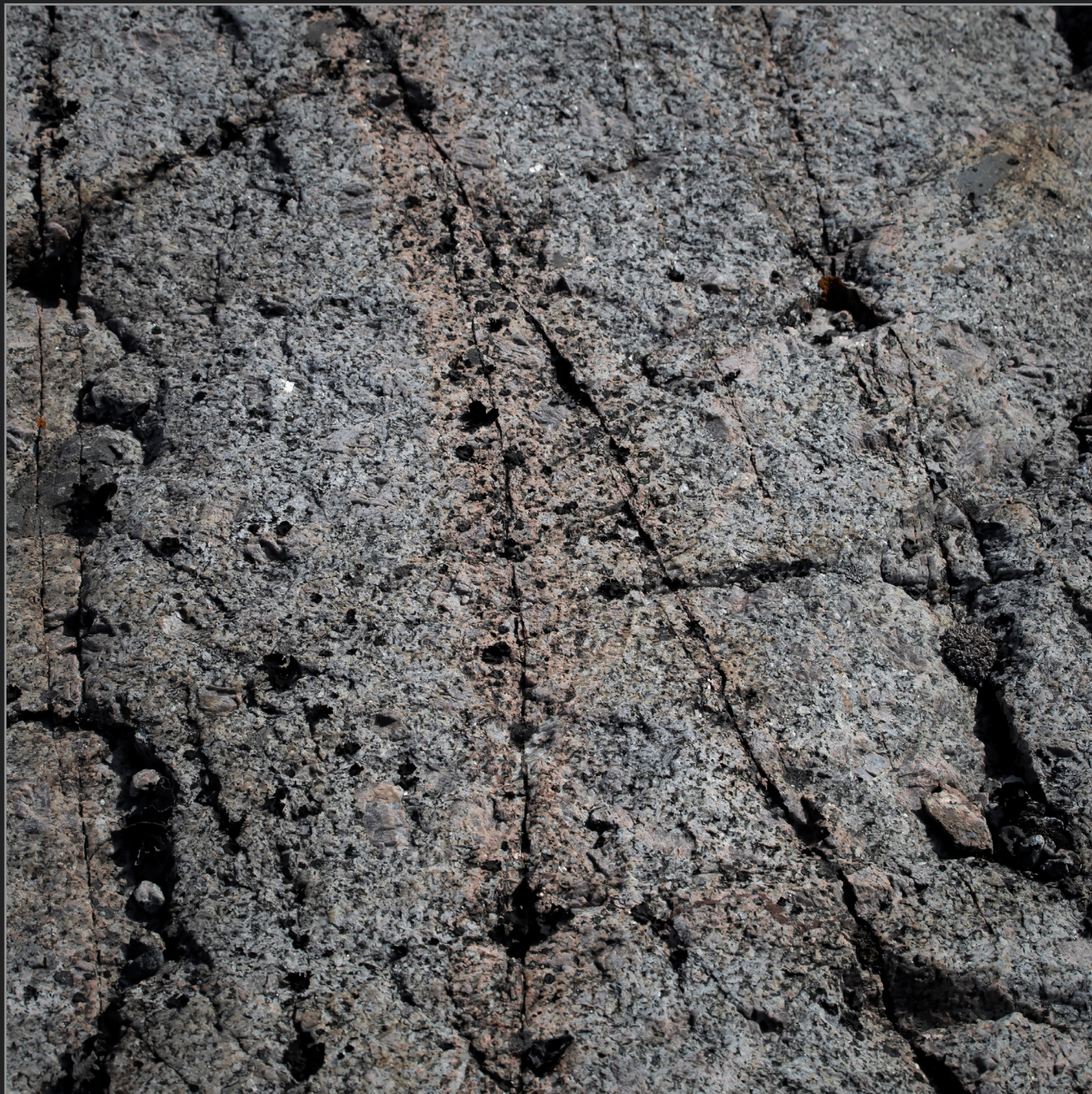
Qaqortoq, Sydgrønland, august 2015