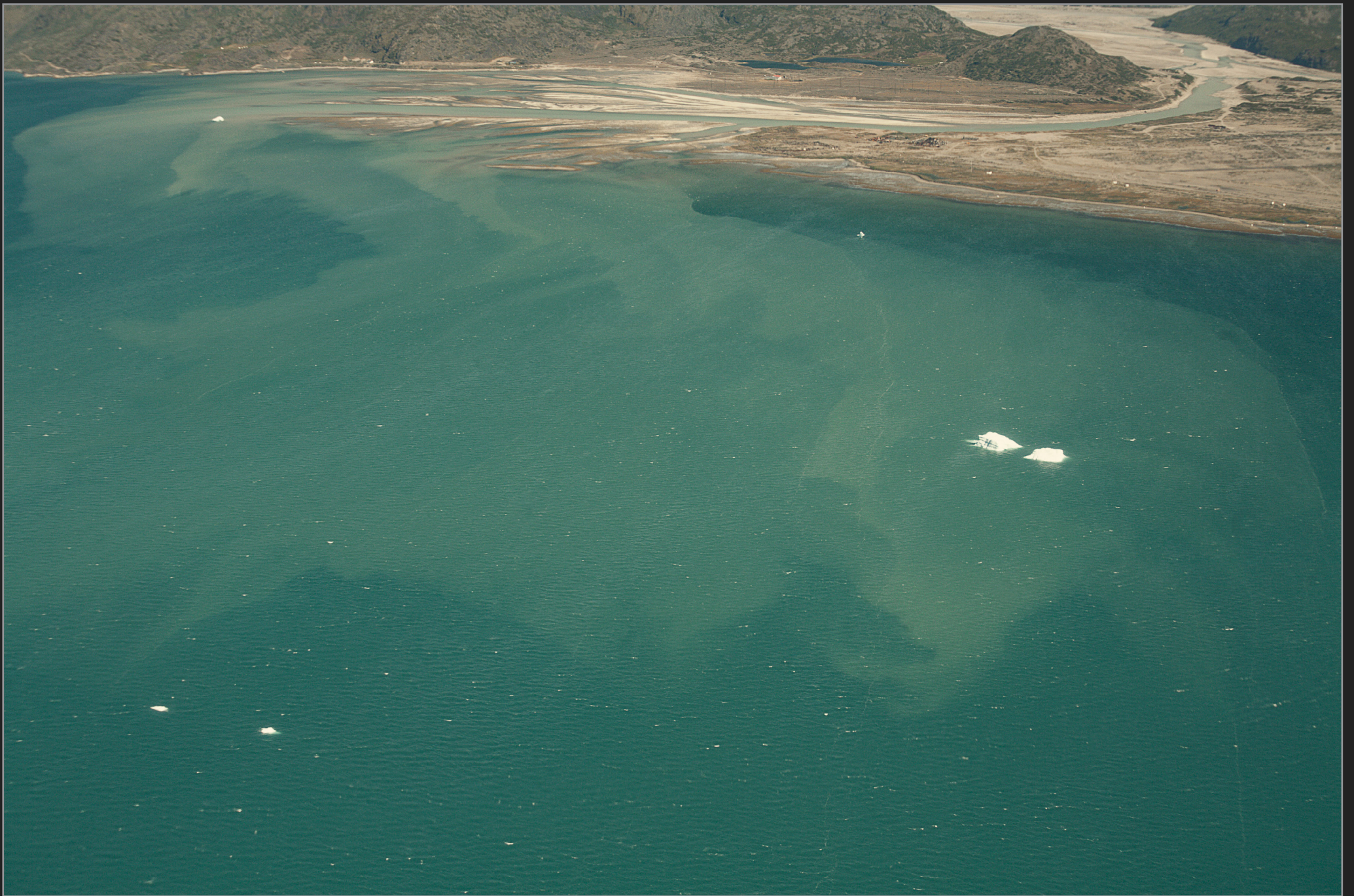
Vestgrønland, august 2009