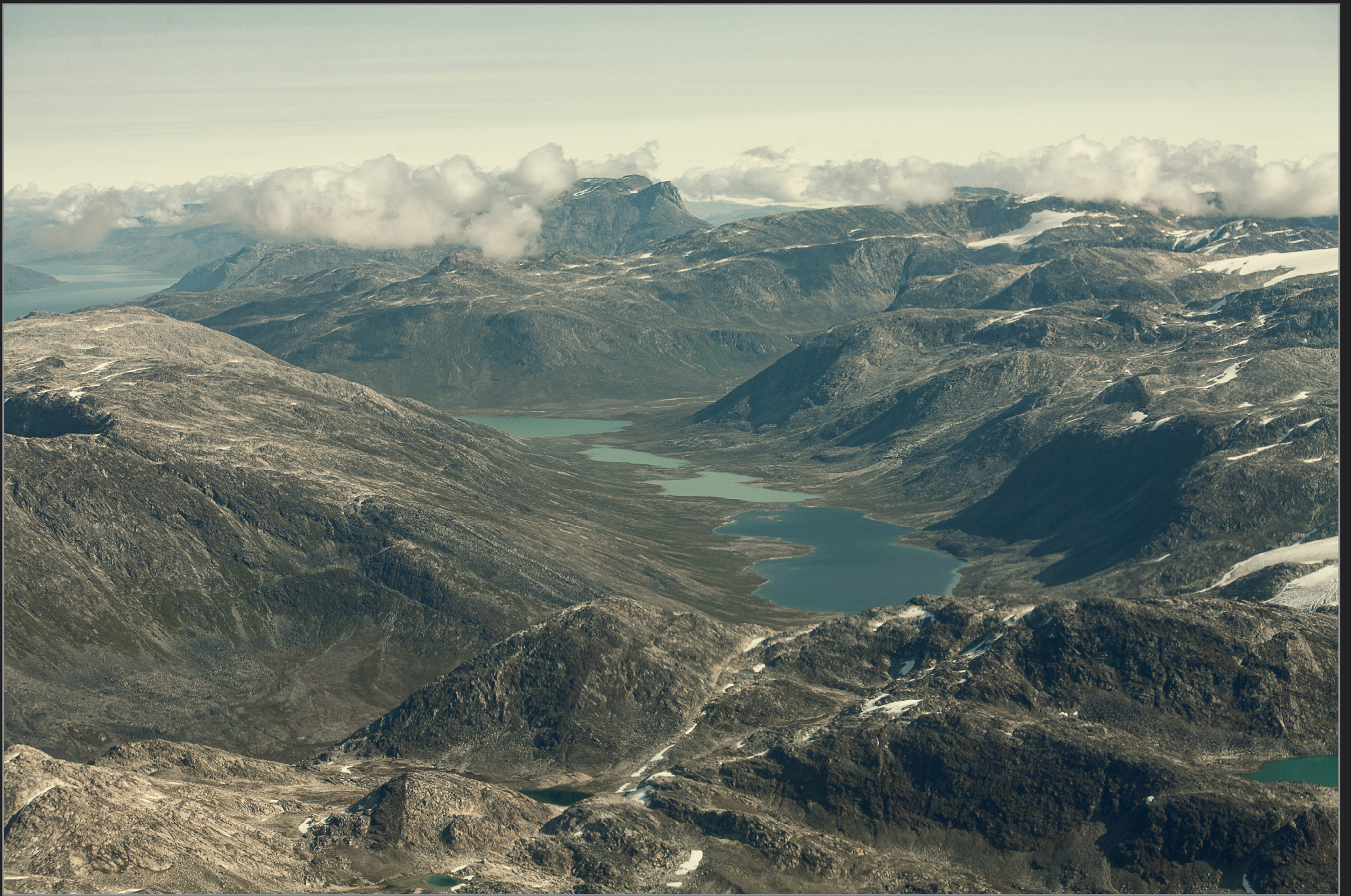
Vestgrønland, august 2009