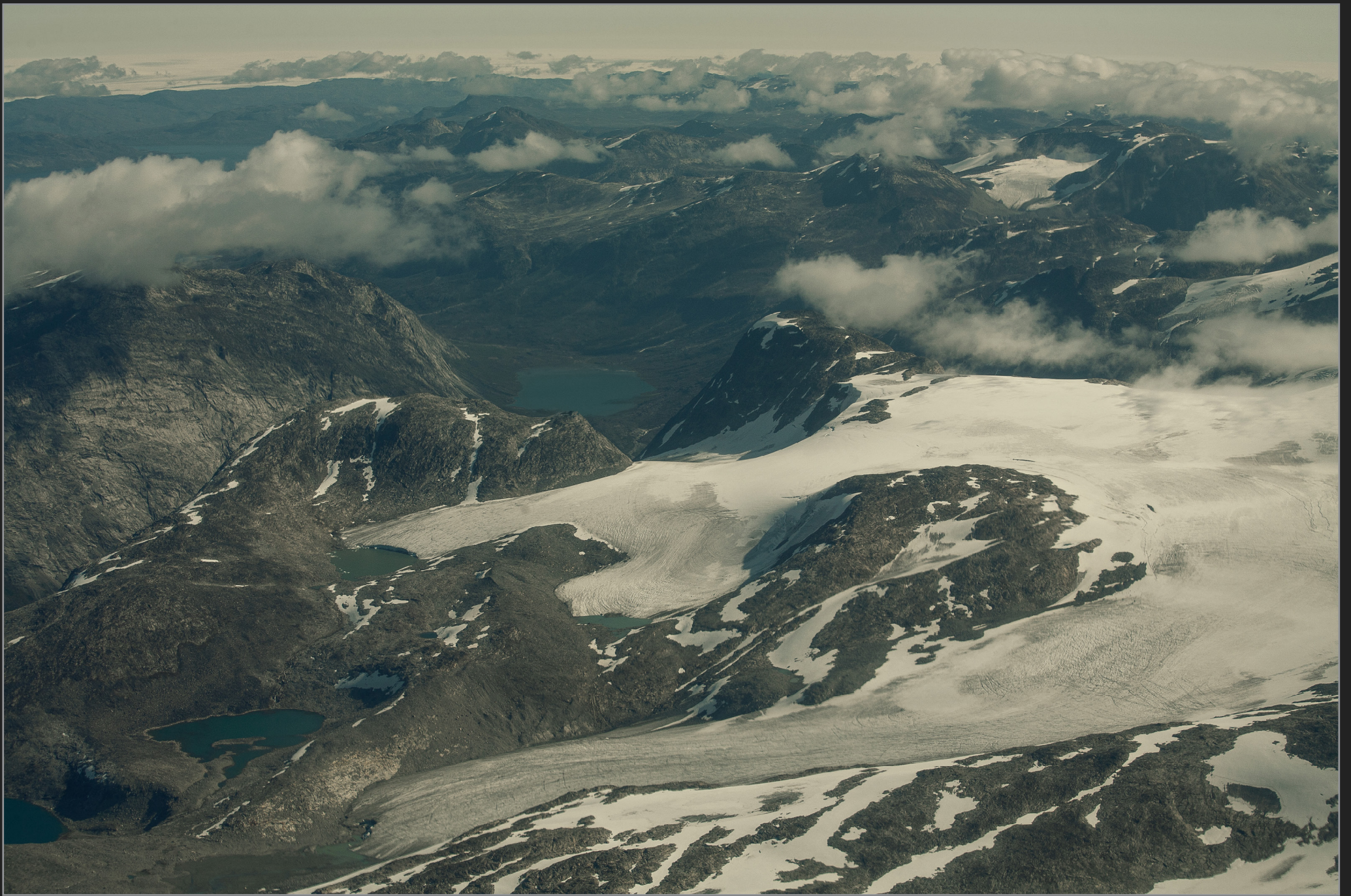
Vestgrønland, august 2009