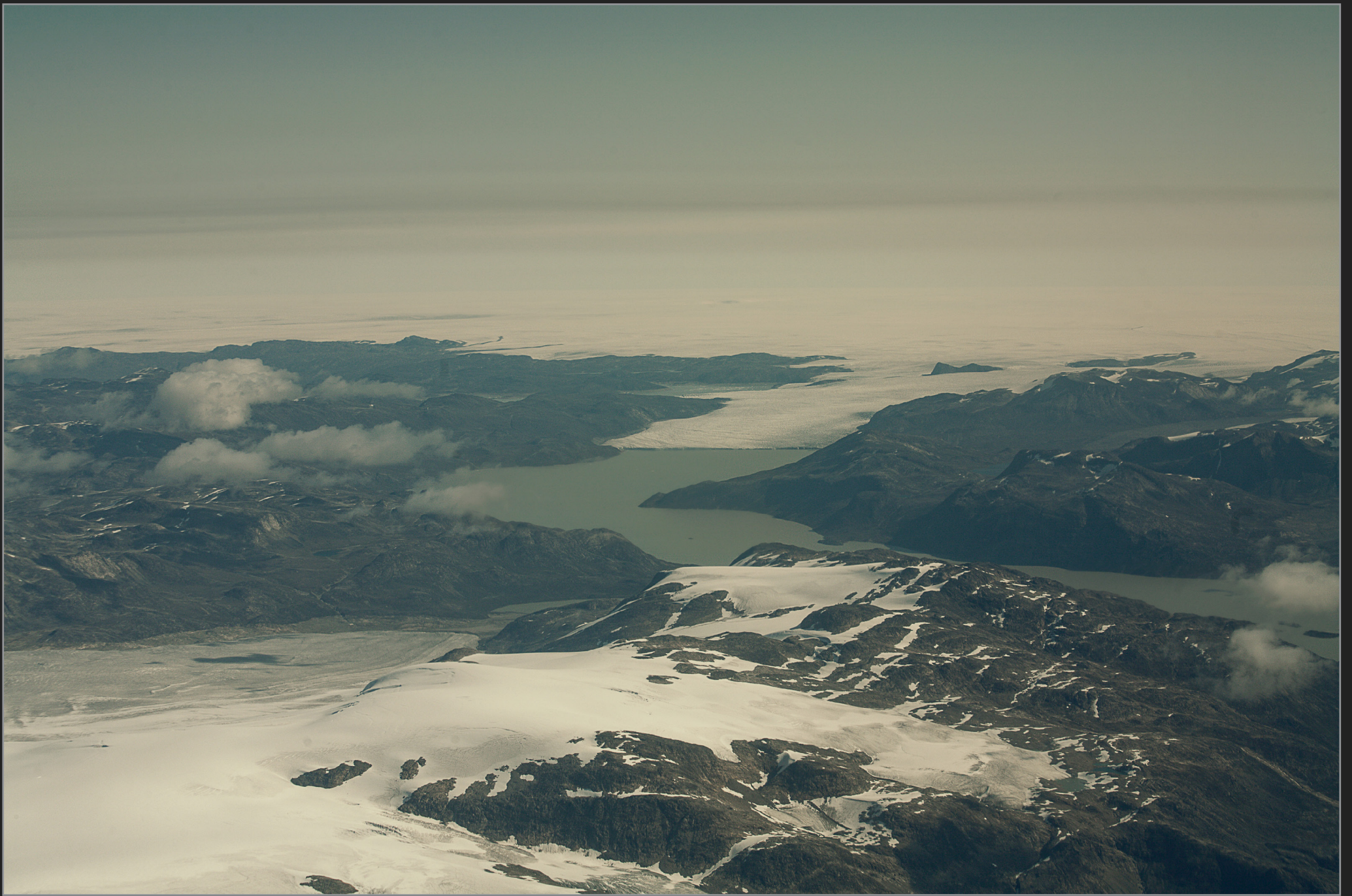
Vestgrønland, august 2009