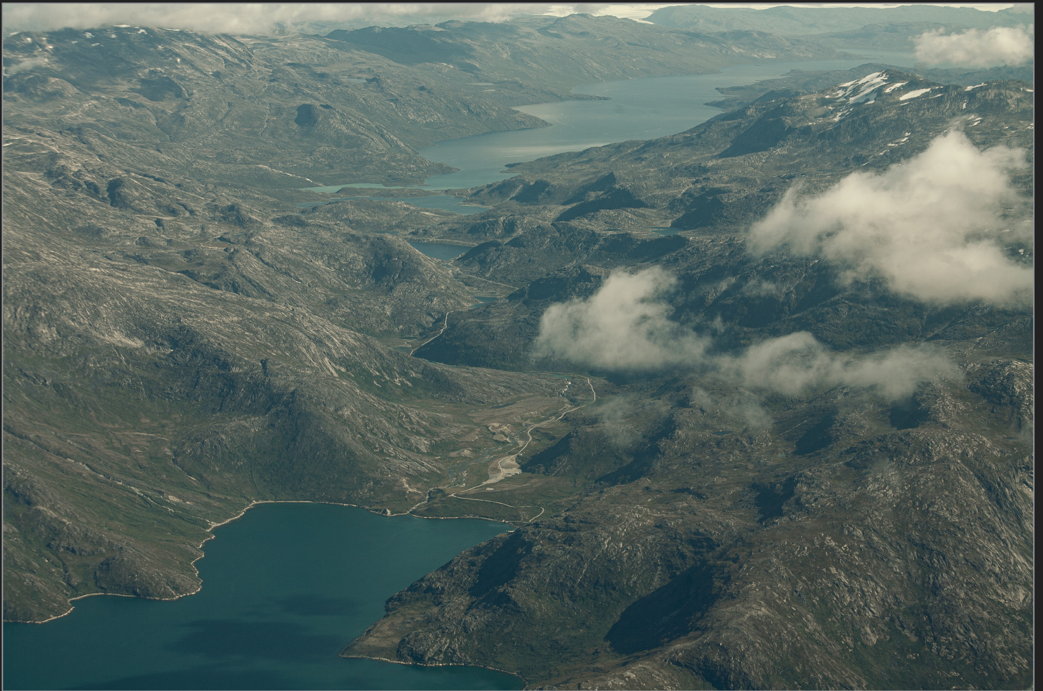
Vestgrønland, august 2009