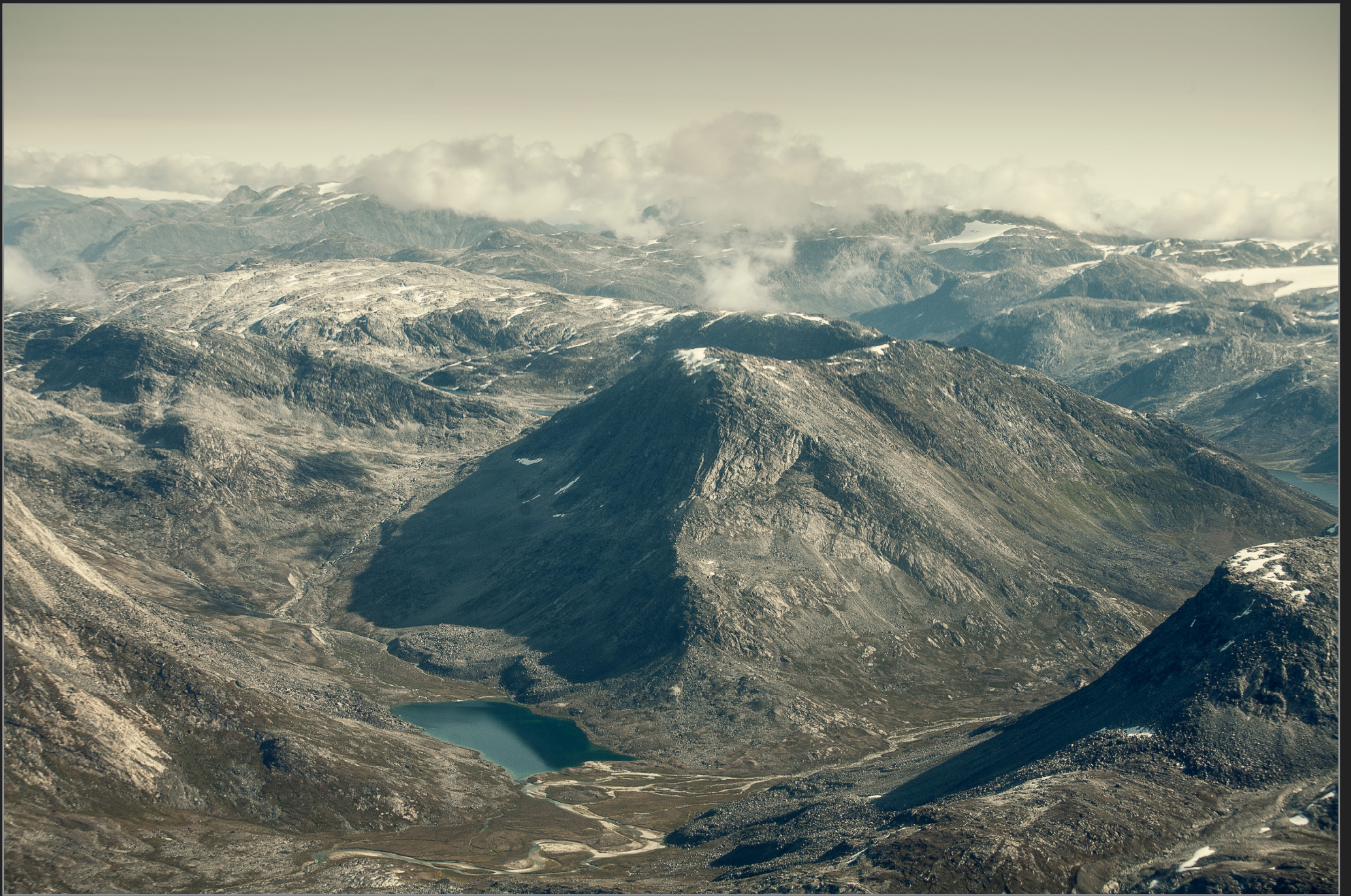
Vestgrønland, august 2009