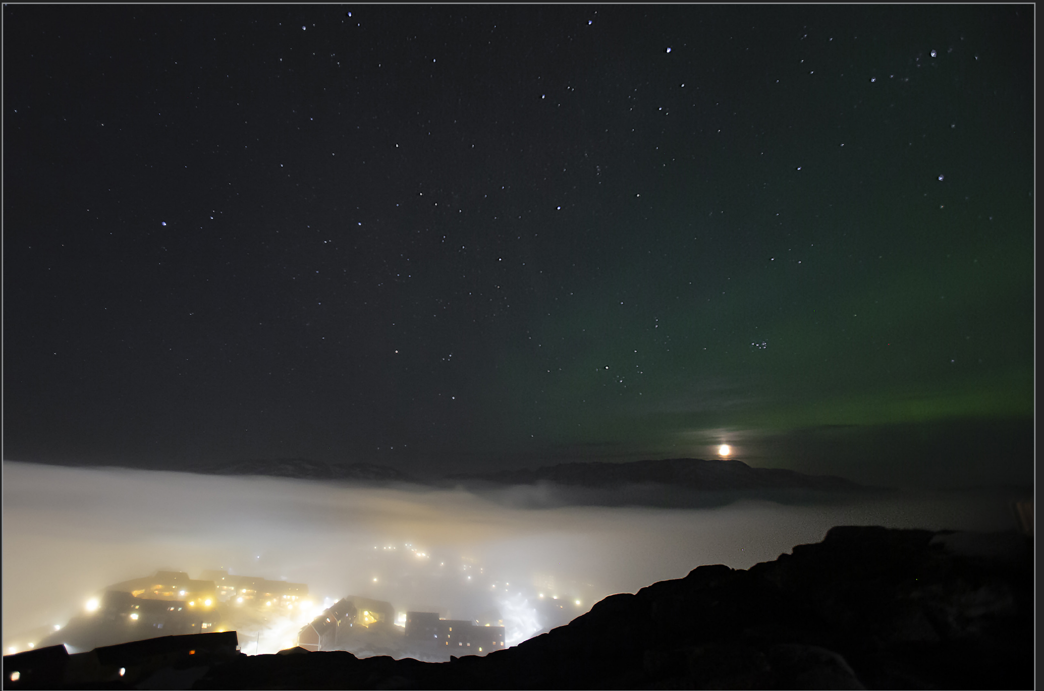
Qaqortoq, Sydgrønland, marts 2018