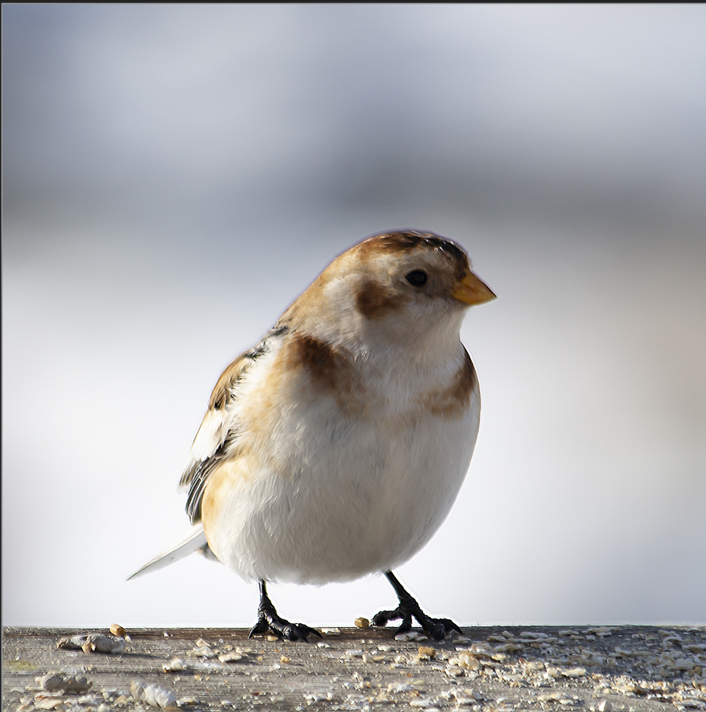
Qaqortoq, Sydgrønland, februar 2018