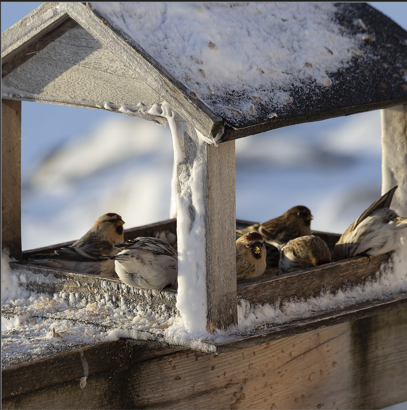
Qaqortoq, Sydgrønland, februar 2018