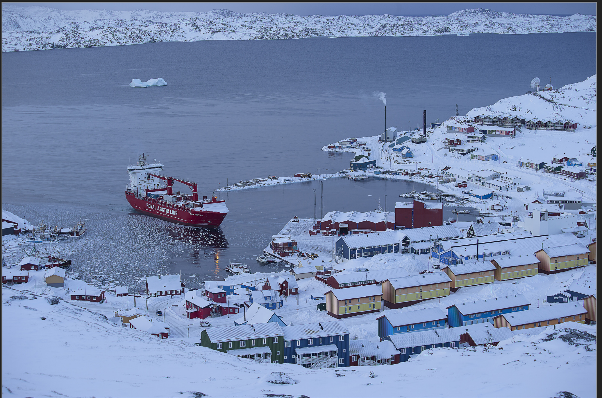
Qaortoq, Sydgrønland, februar 2018