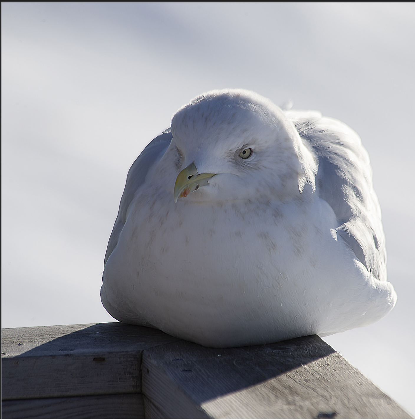
Qaqortoq, Sydgrønland, februar 2018