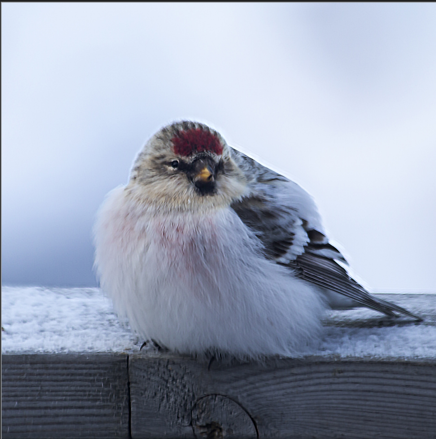
Qaqortoq, Sydgrønland, februar 2018