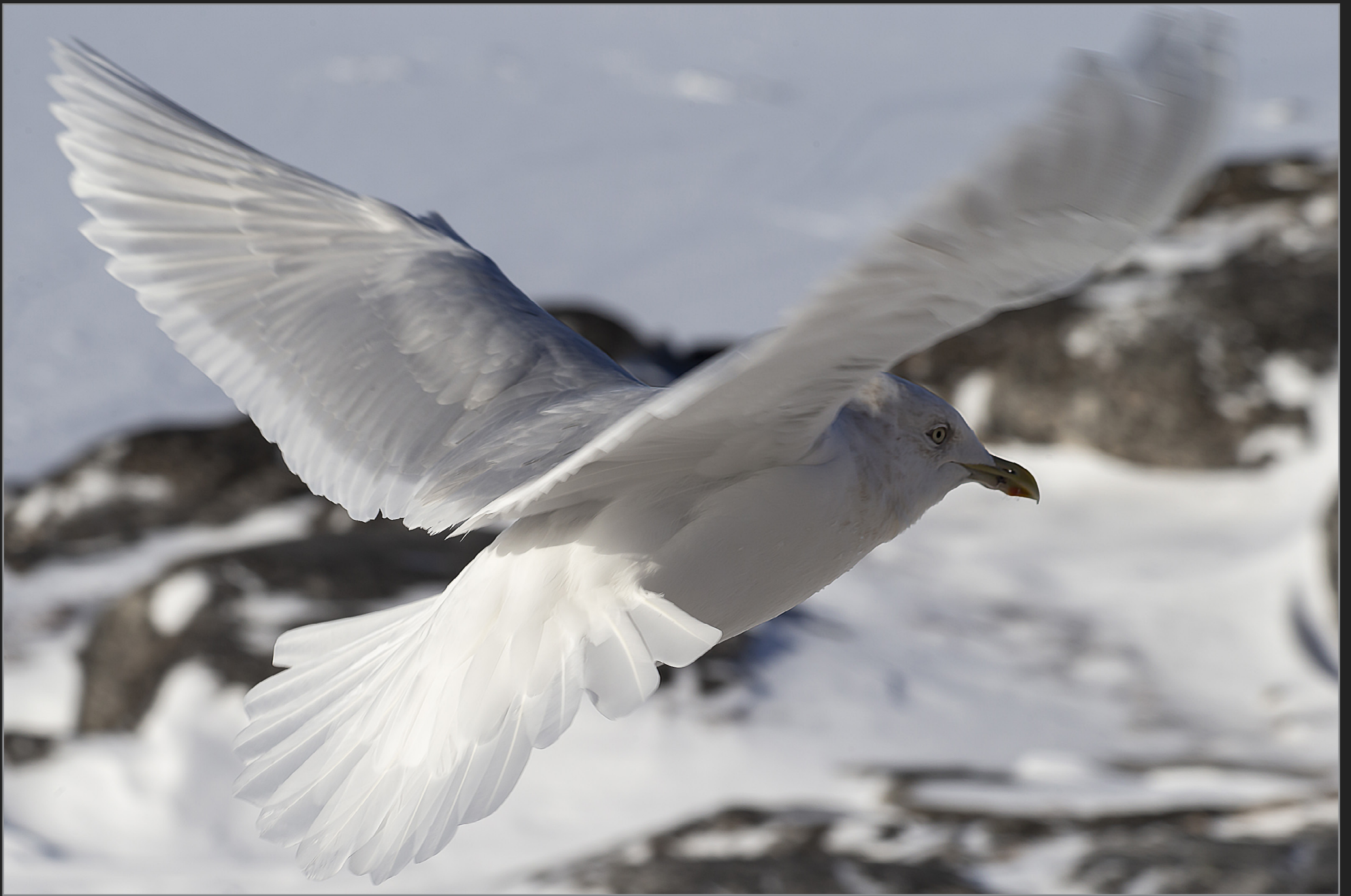
Qaqortoq, Sydgrønland, februar 2018