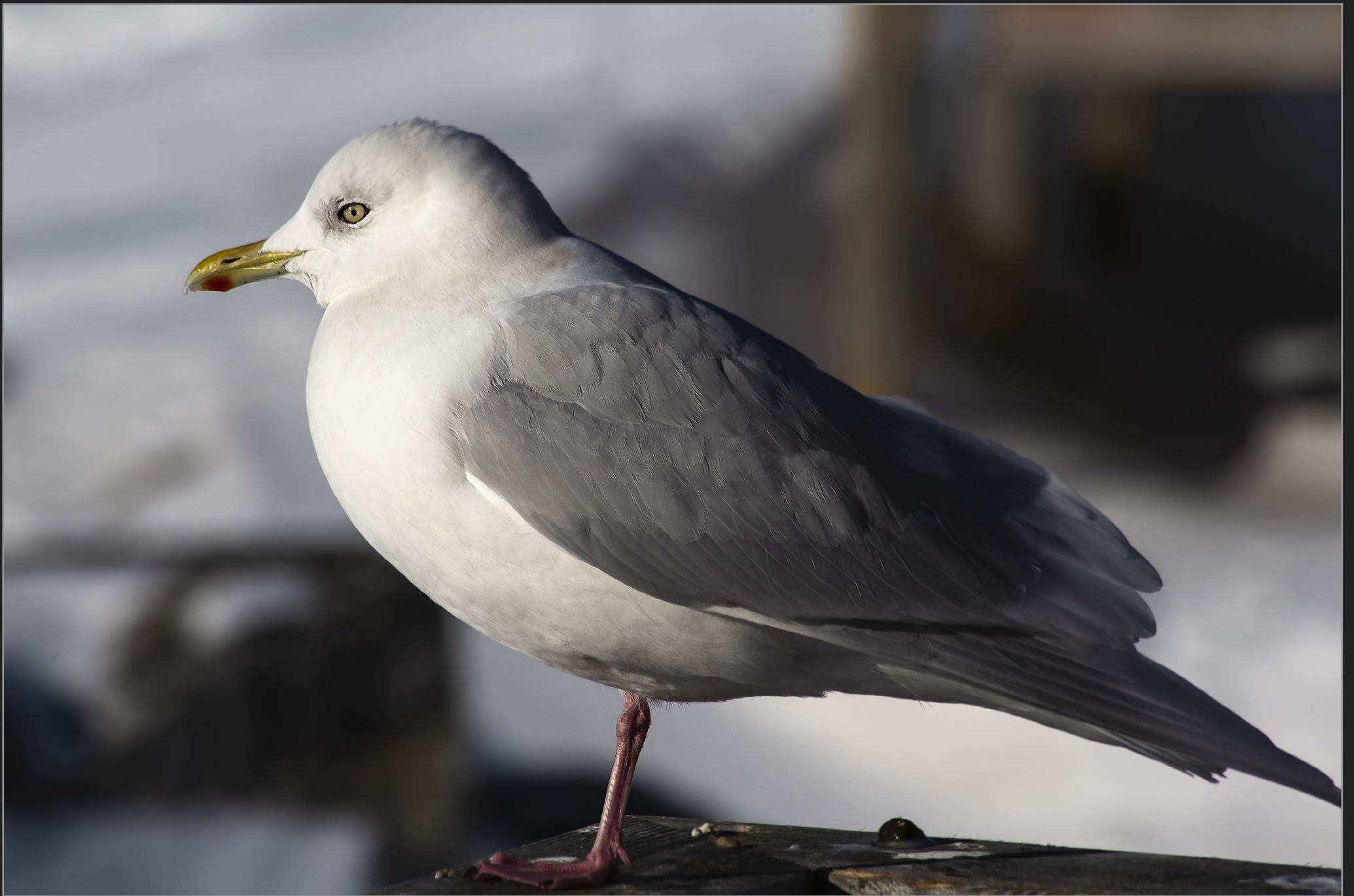
Qaqortoq, Sydgrønland, februar 2018