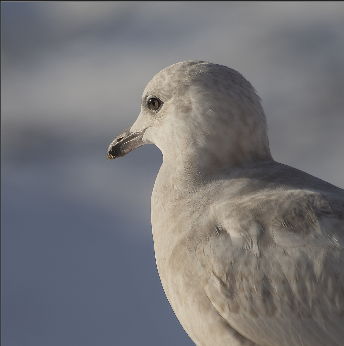
Qaqortoq, Sydgrønland, februar 2018