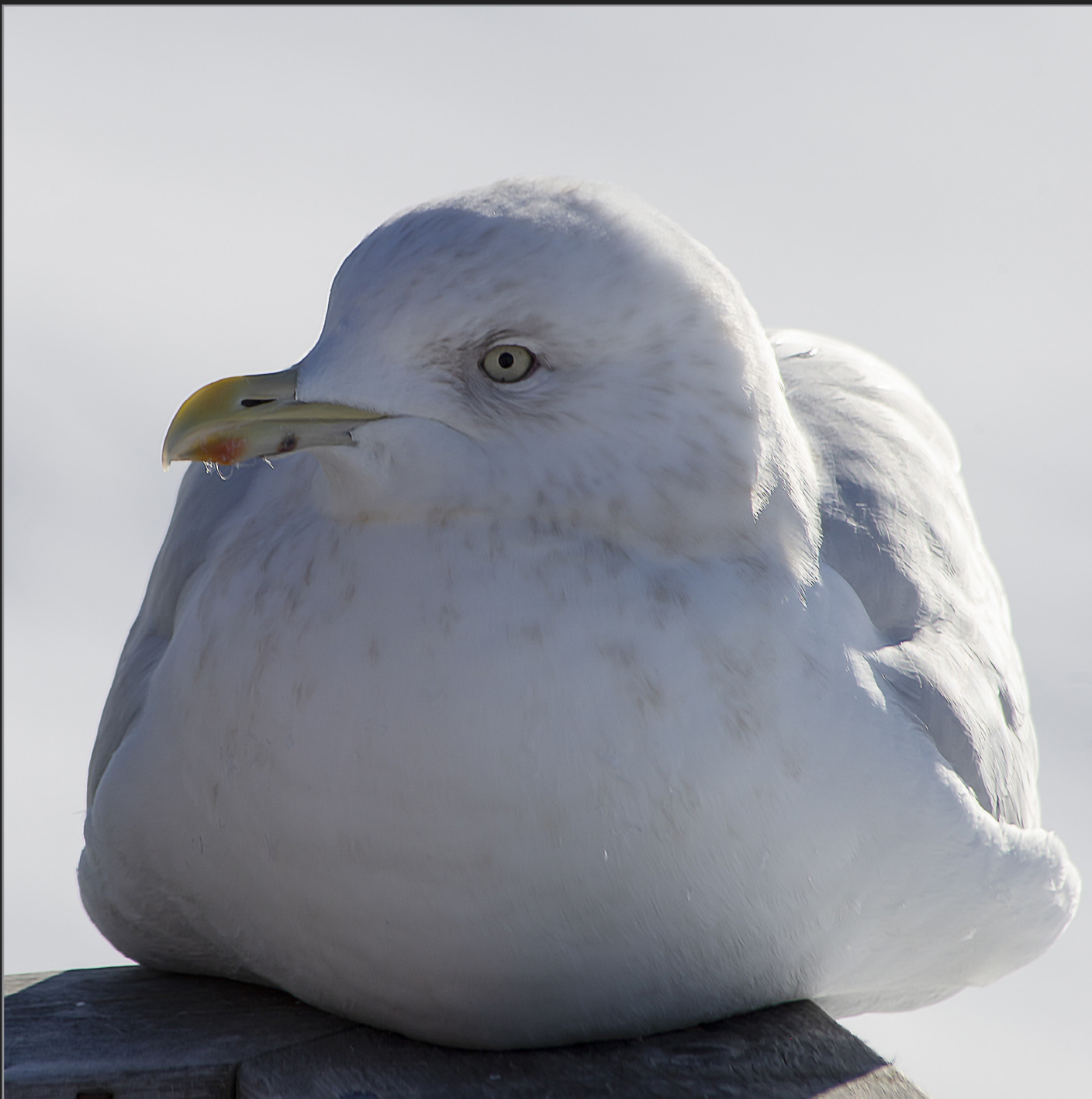
Qaqortoq, Sydgrønland, februar 2018