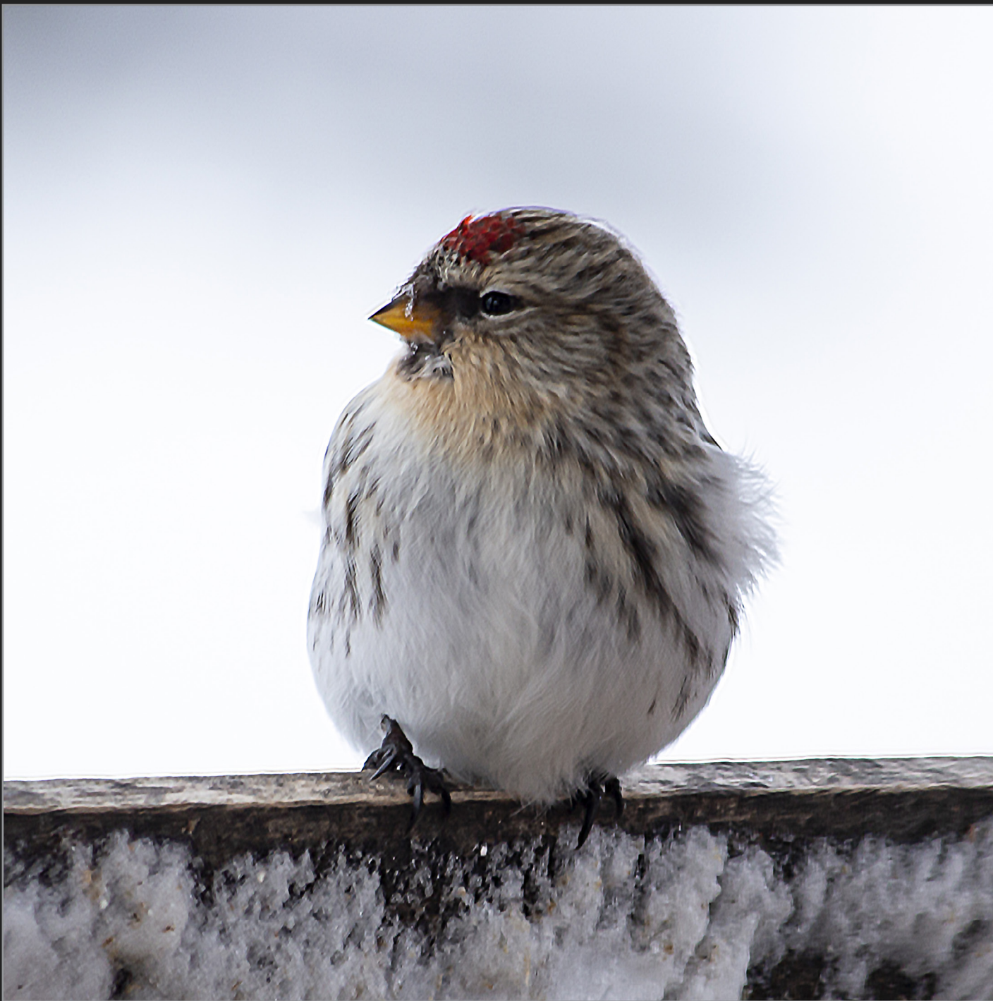
Qaqortoq, Sydgrønland, februar 2018