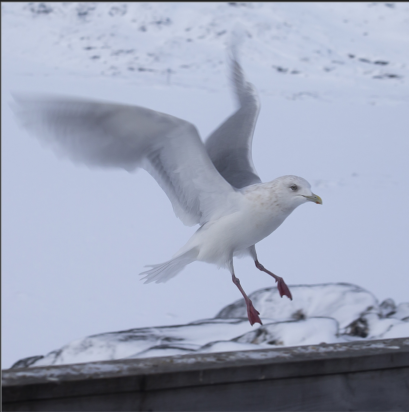
Qaqortoq, Sydgrønland, februar 2018