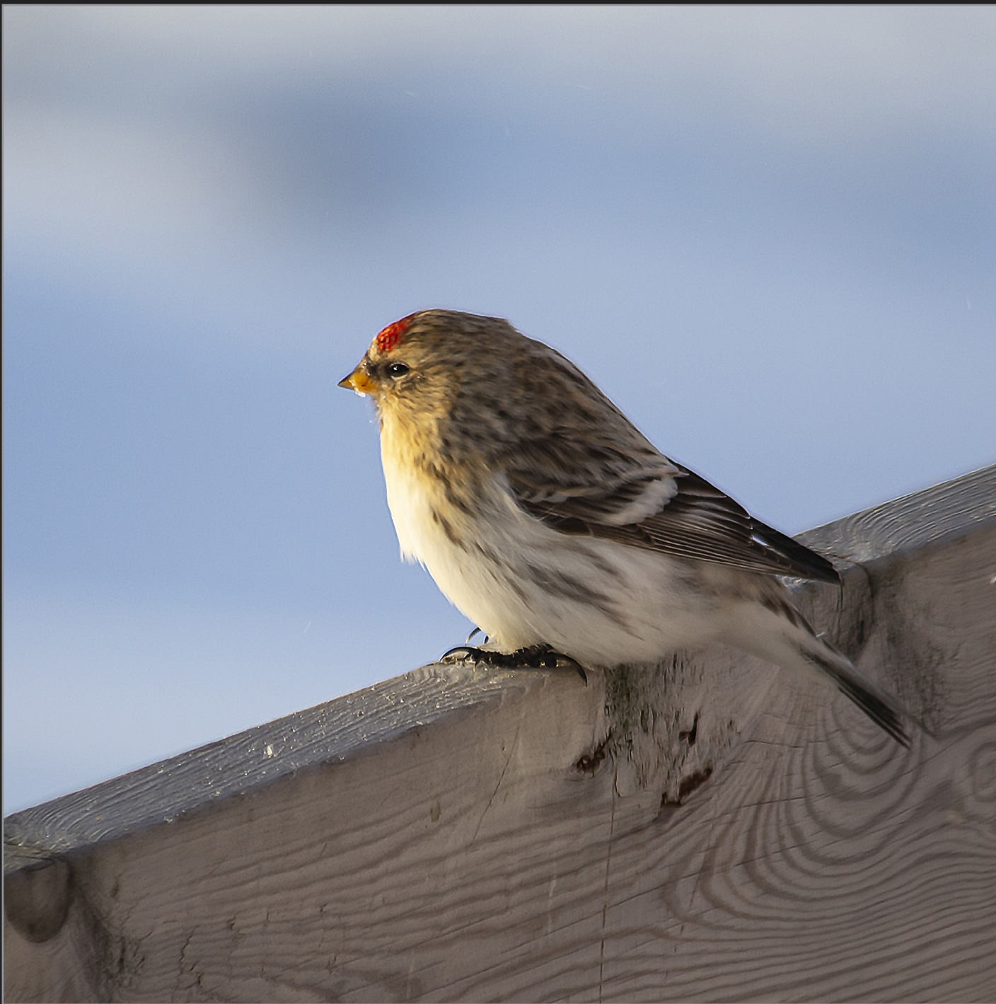
Qaqortoq, Sydgrønland, februar 2018