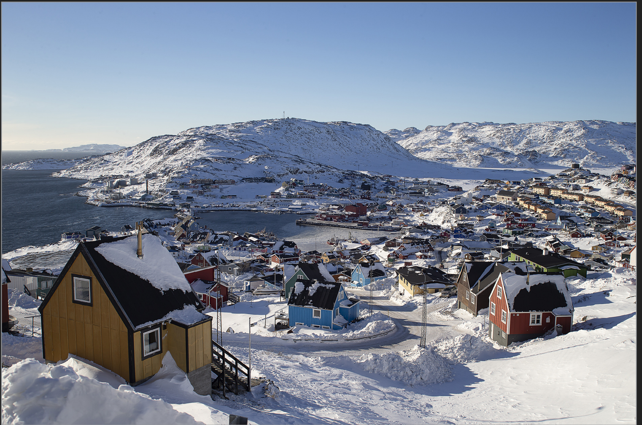
Qaqortoq, Sydgrønland, februar 2018