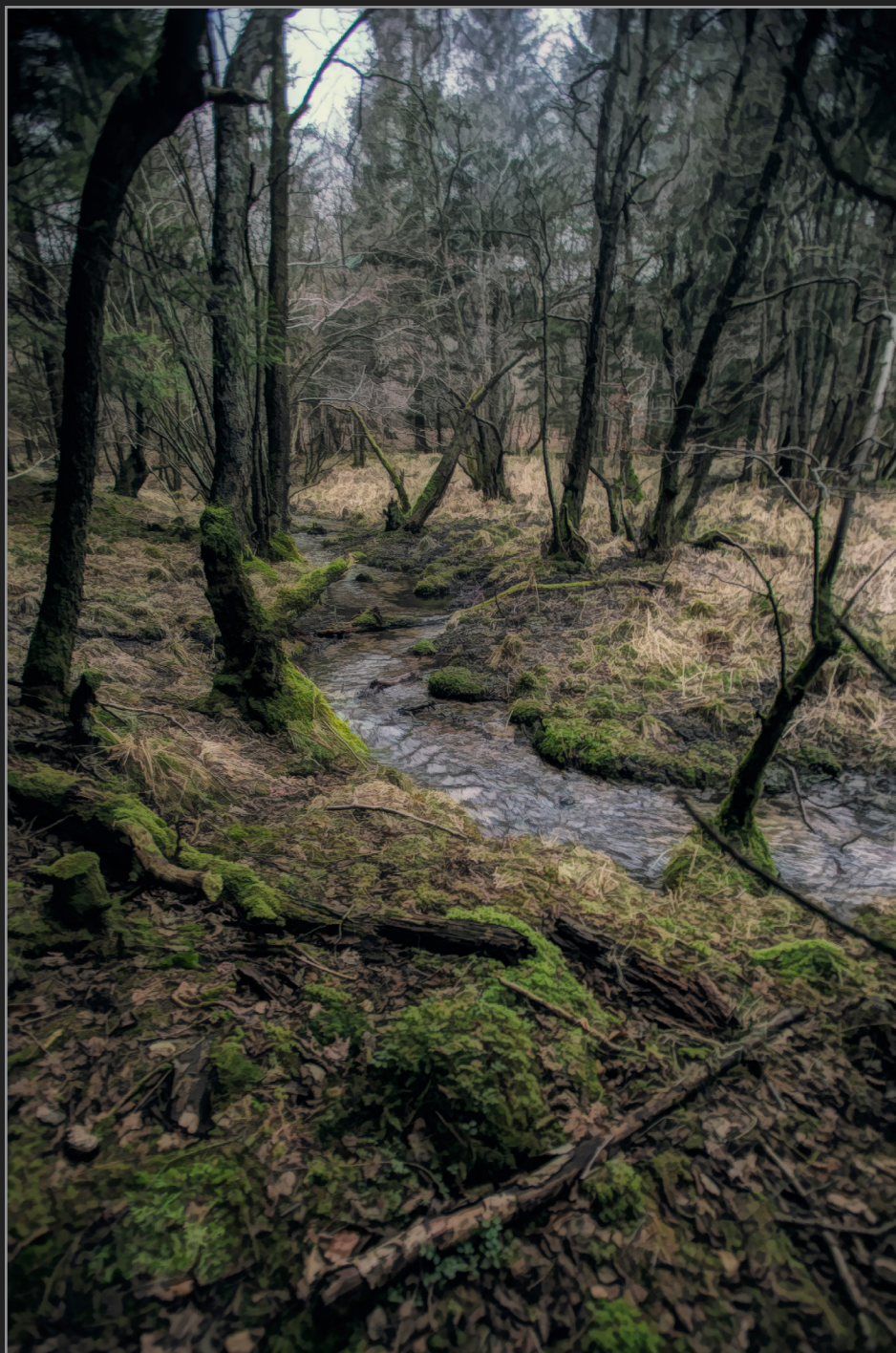
Rold Skov, december 2016