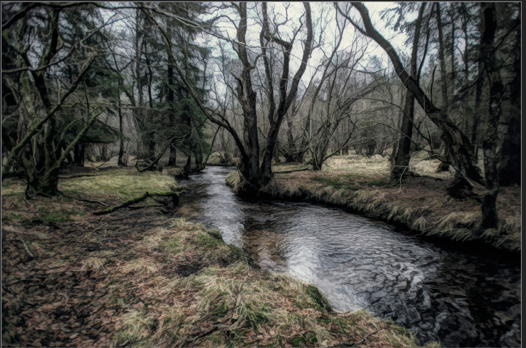
Rold Skov, december 2016