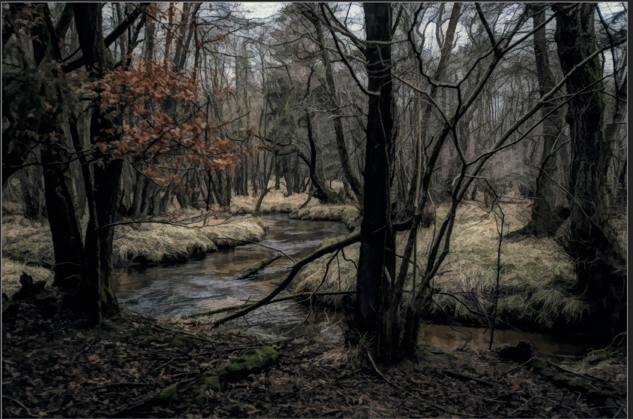
Rold Skov, december 2016