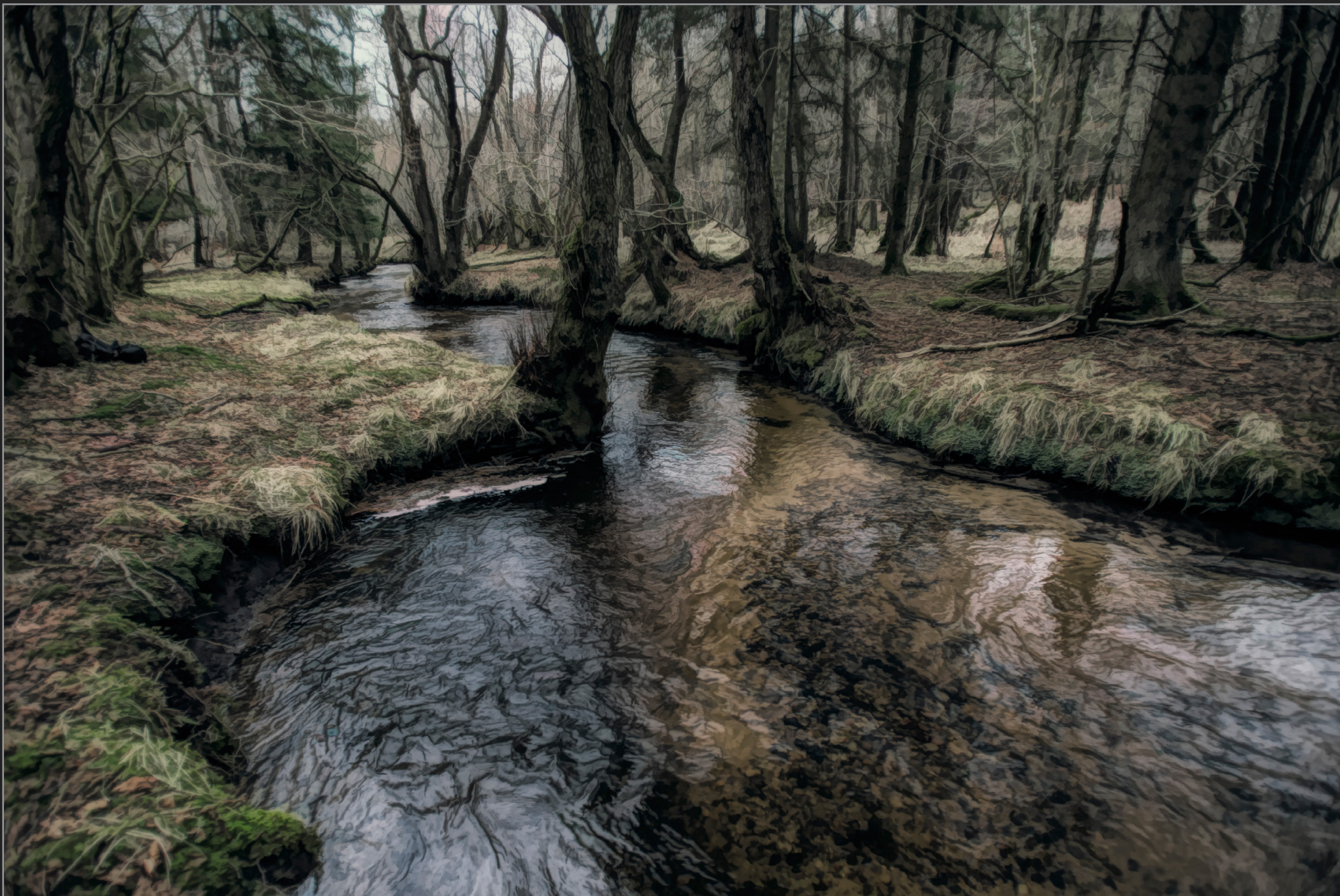
Rold Skov, december 2016