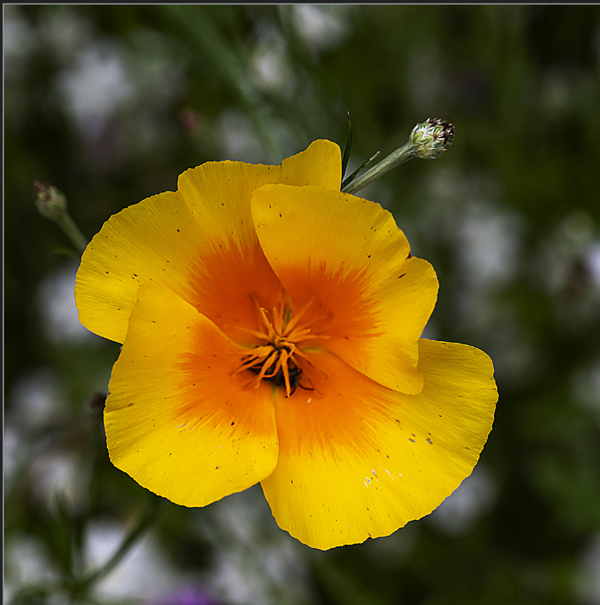
Sønder Kongerslev, juli 2022