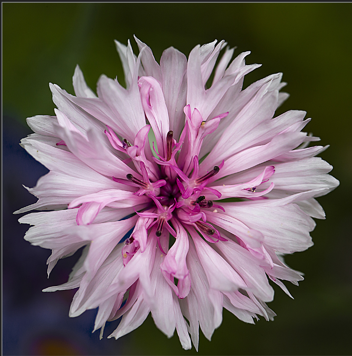
Sønder Kongerslev, juli 2022