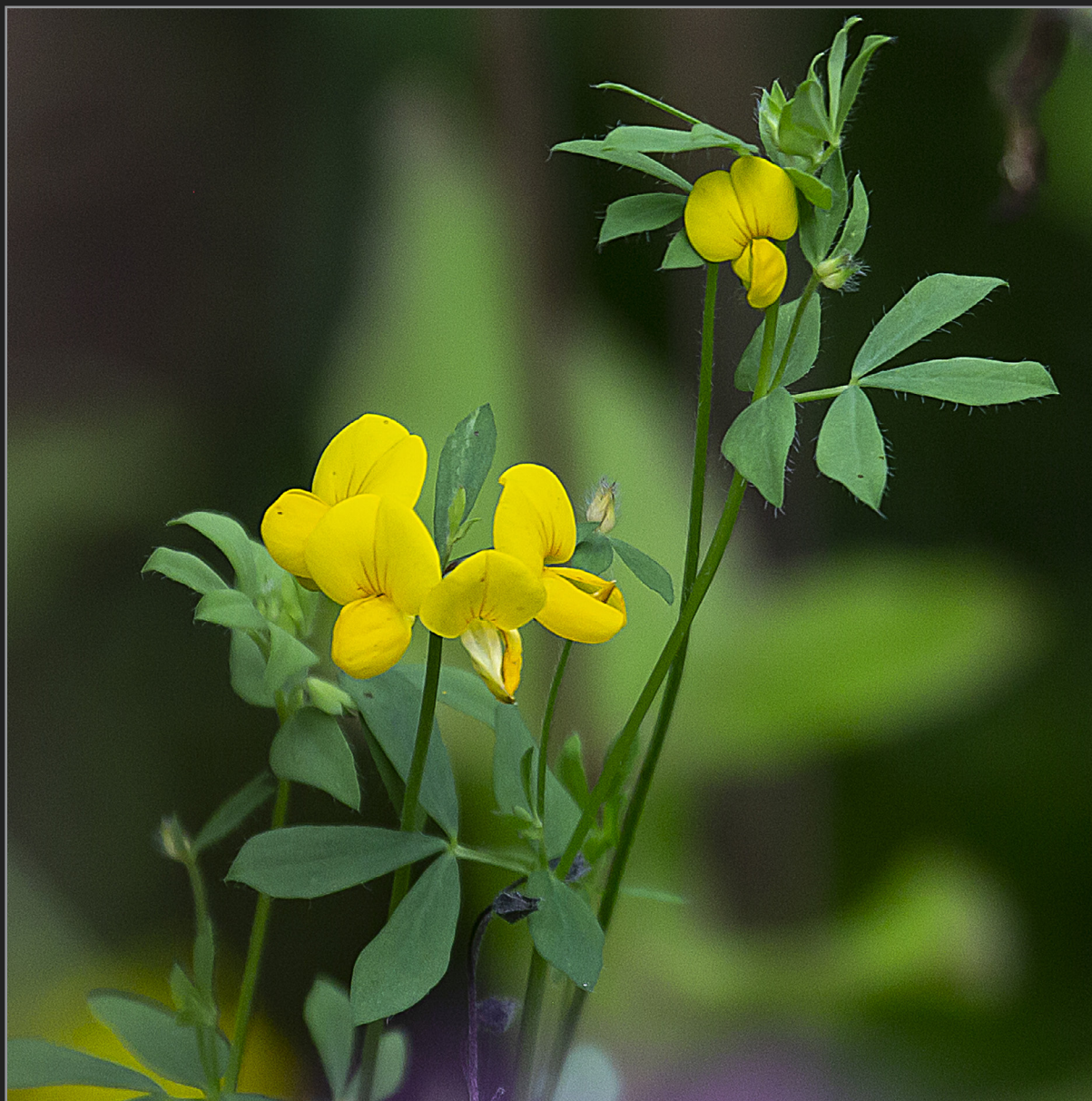
Sønder Kongerslev, juli 2022