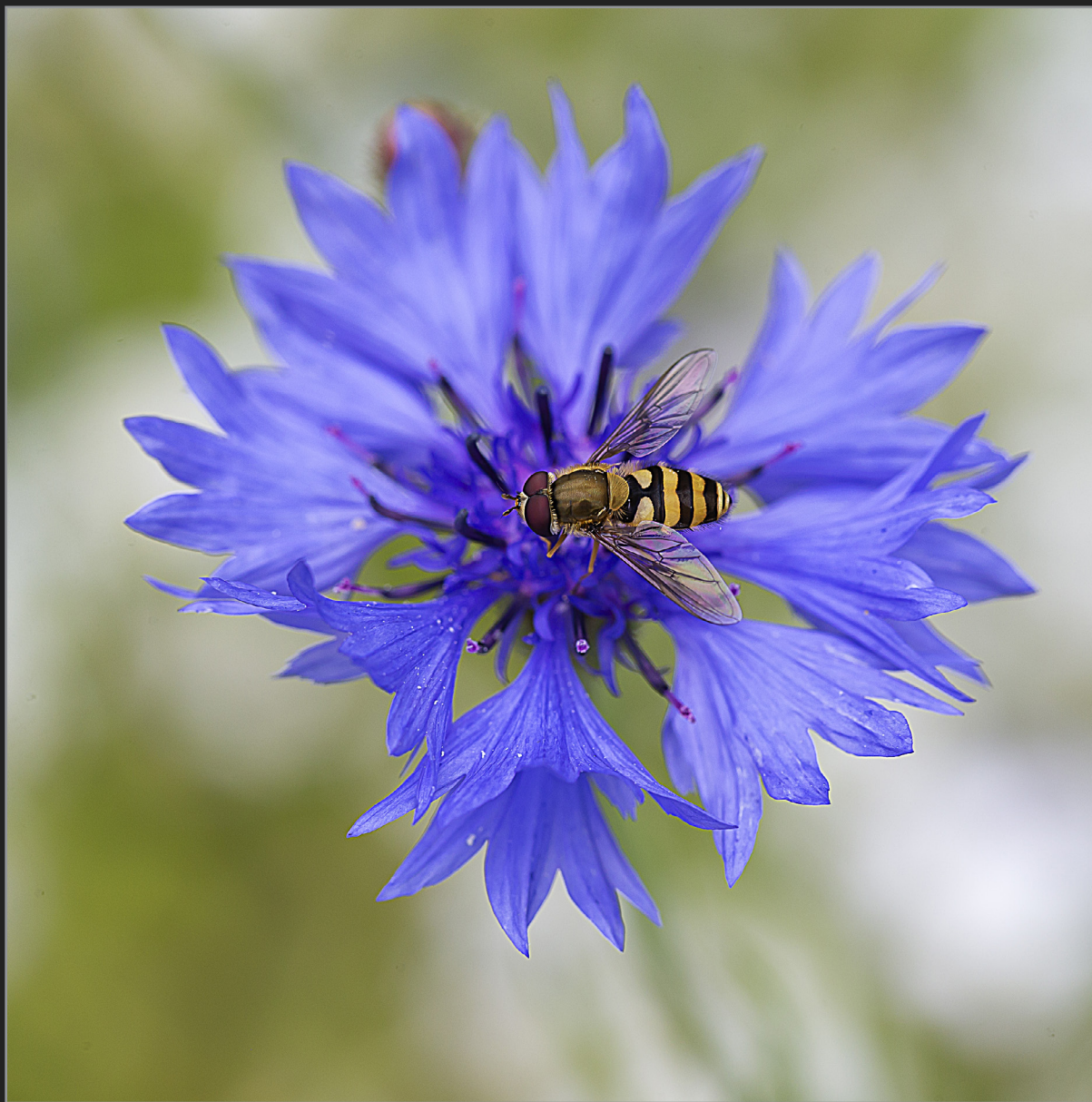
Sønder Kongerslev, juli 2022