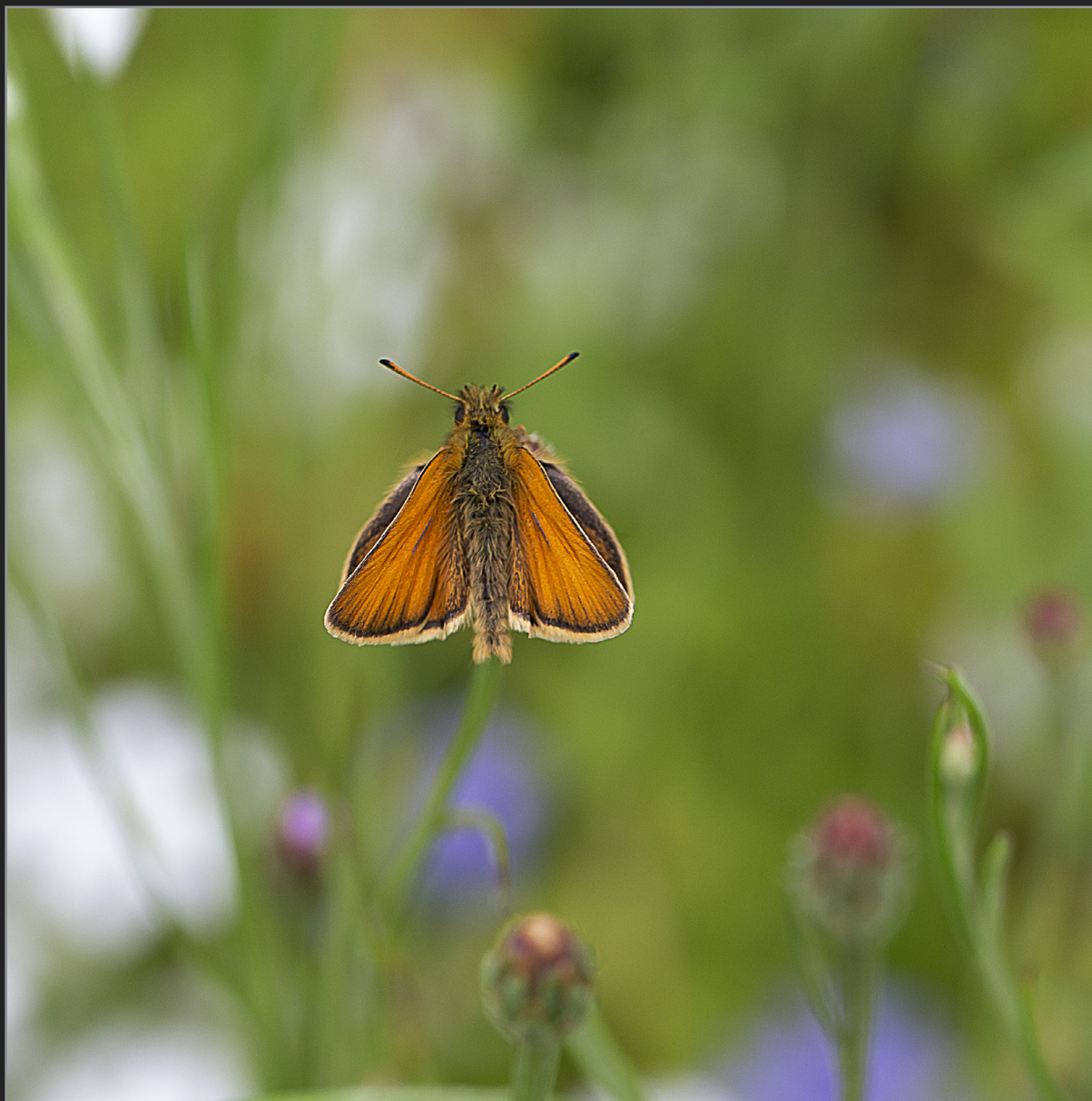
Sønder Kongerslev, juli 2022