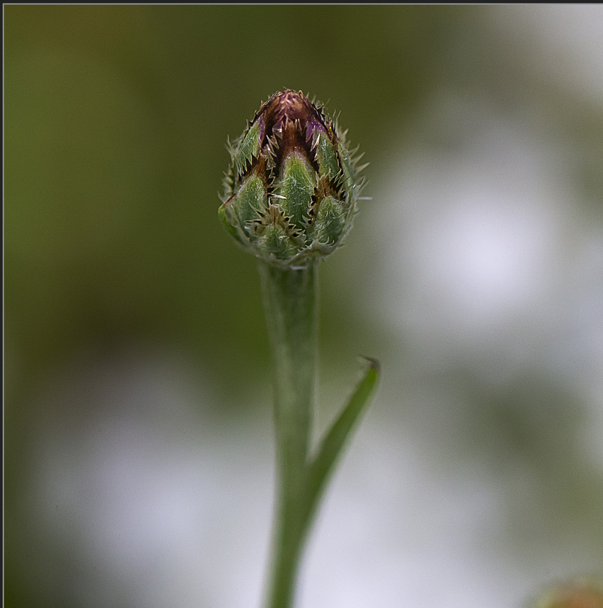
Sønder Kongerslev, juli 2022