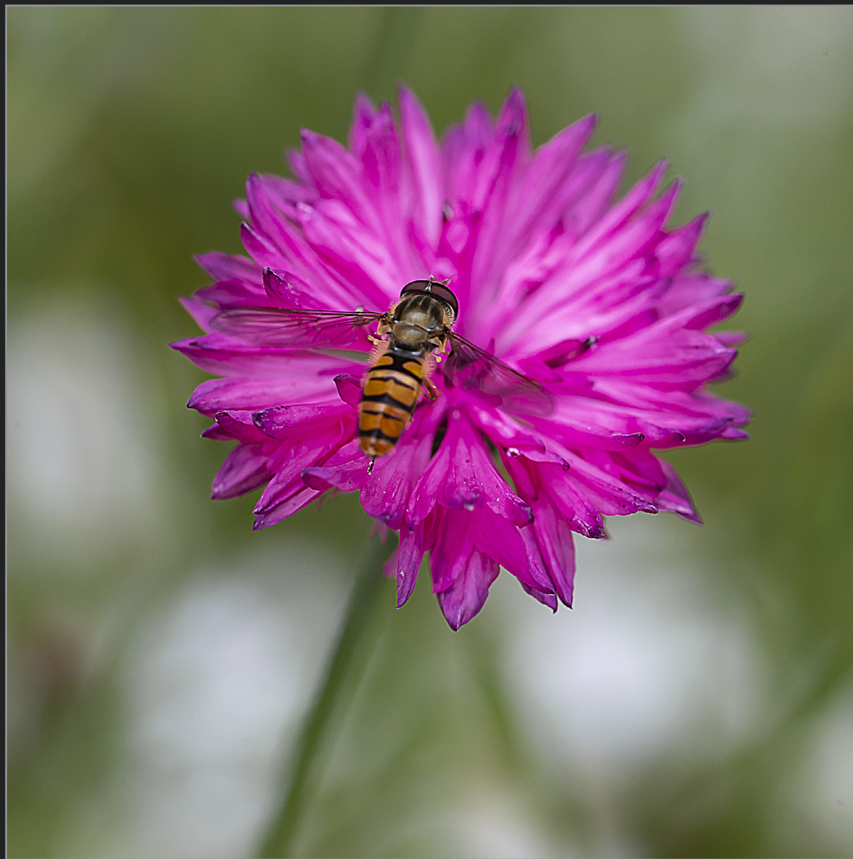
Sønder Kongerslev, juli 2022