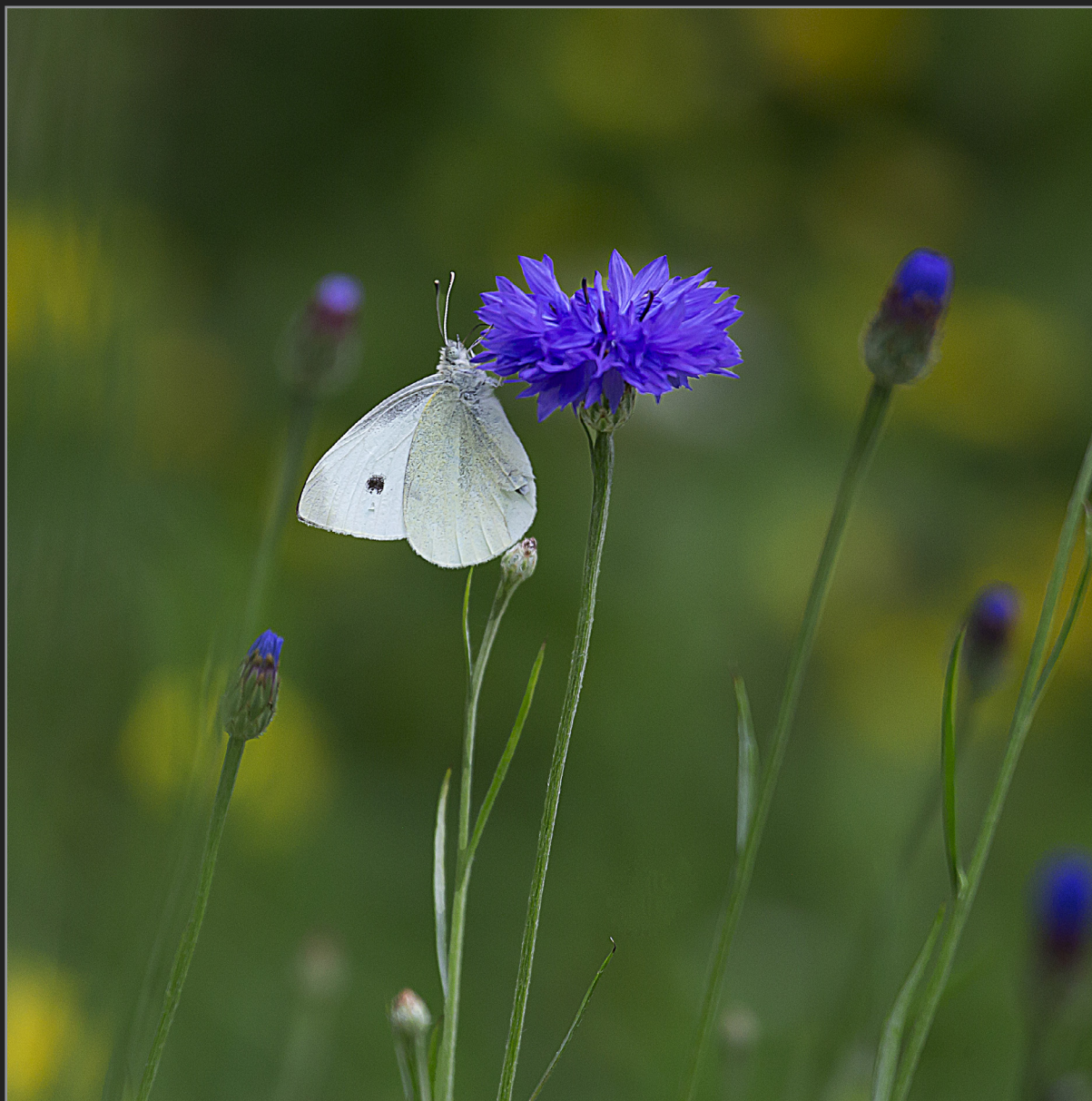
Sønder Kongerslev, juli 2022