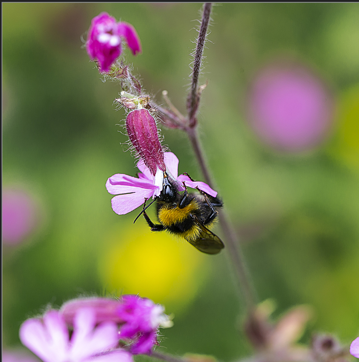
Sønder Kongerslev, juli 2022