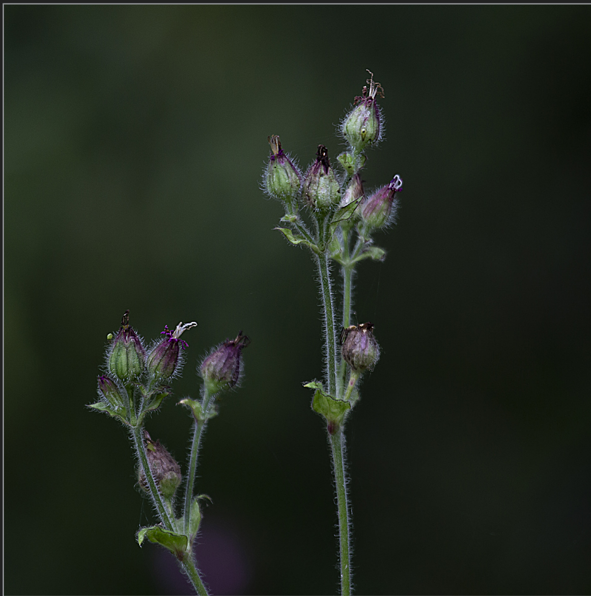
Sønder Kongerslev, juli 2022