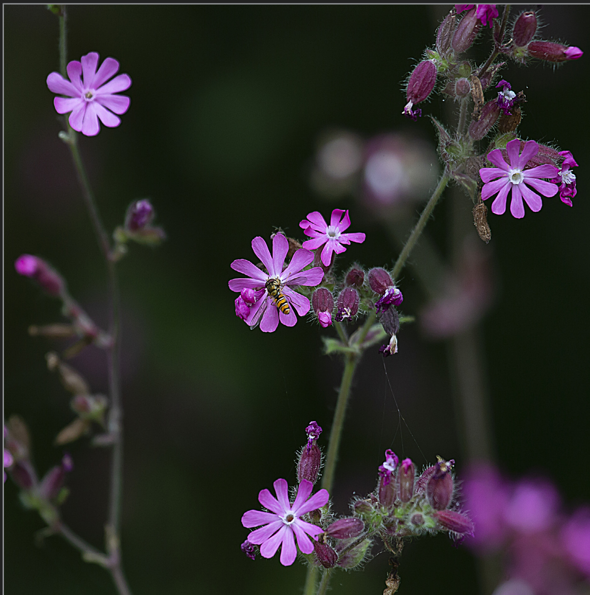
Sønder Kongerslev, juli 2022