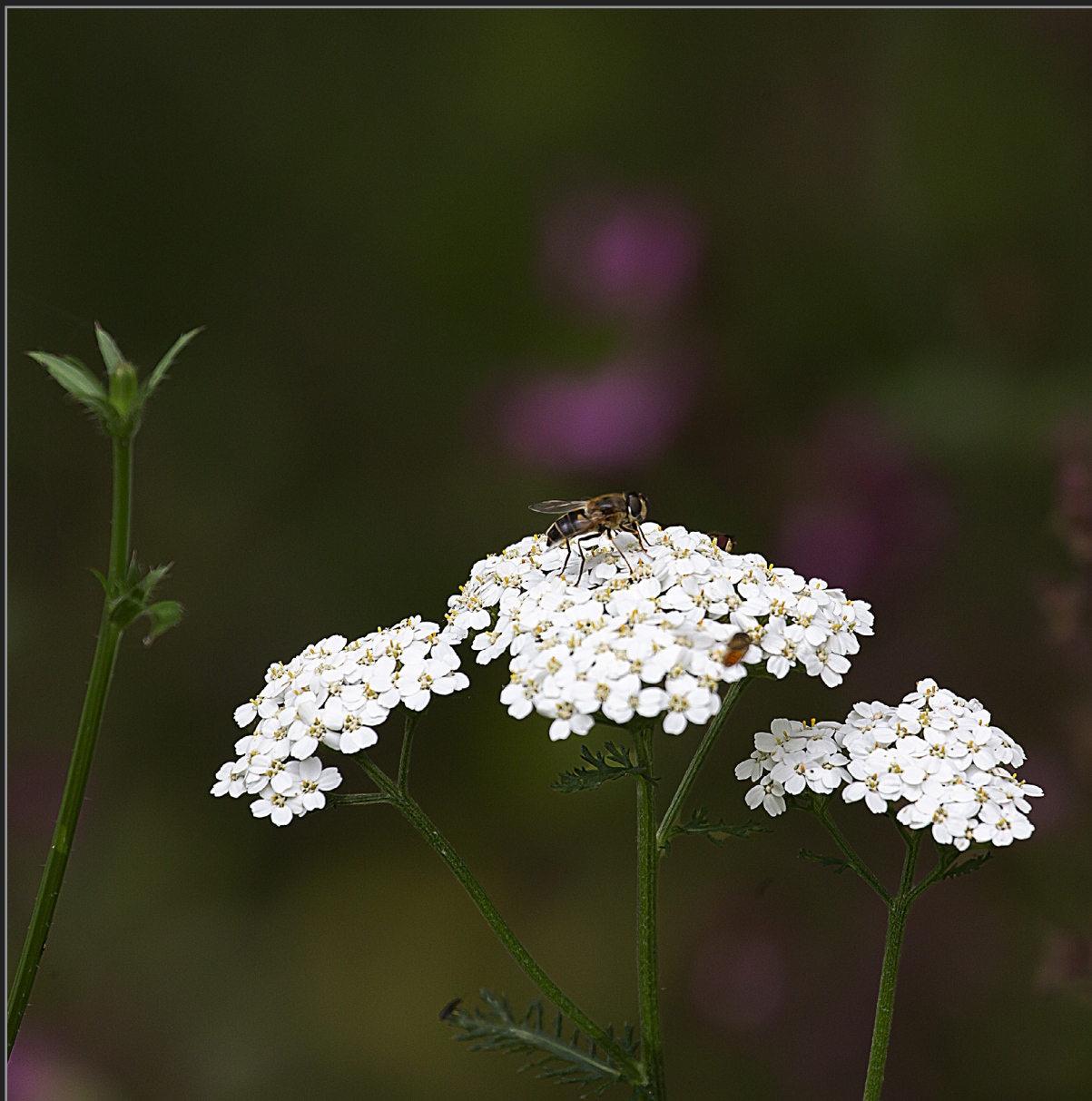
Sønder Kongerslev, juli 2022