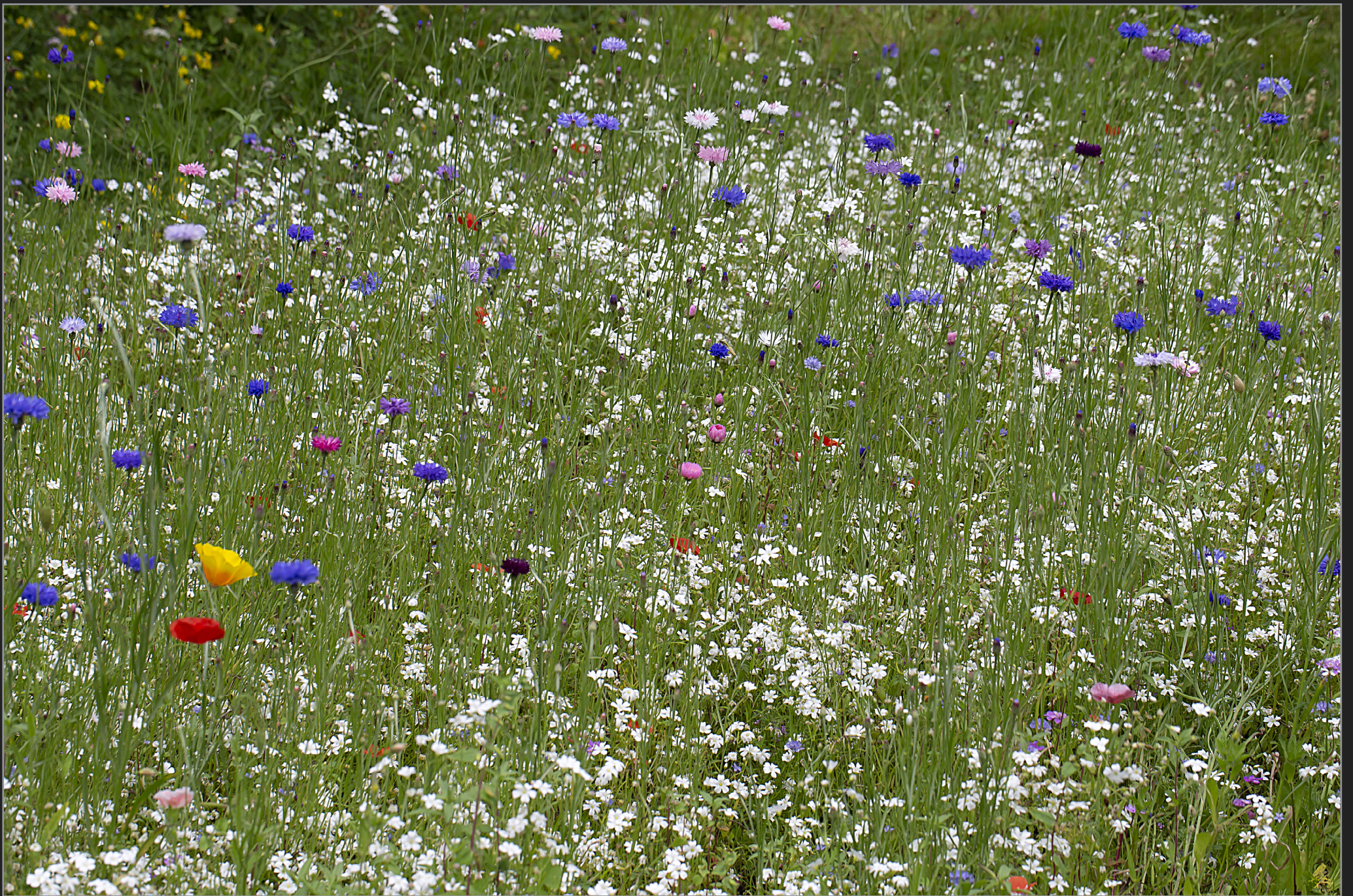
Sønder Kongerslev, juli 2022