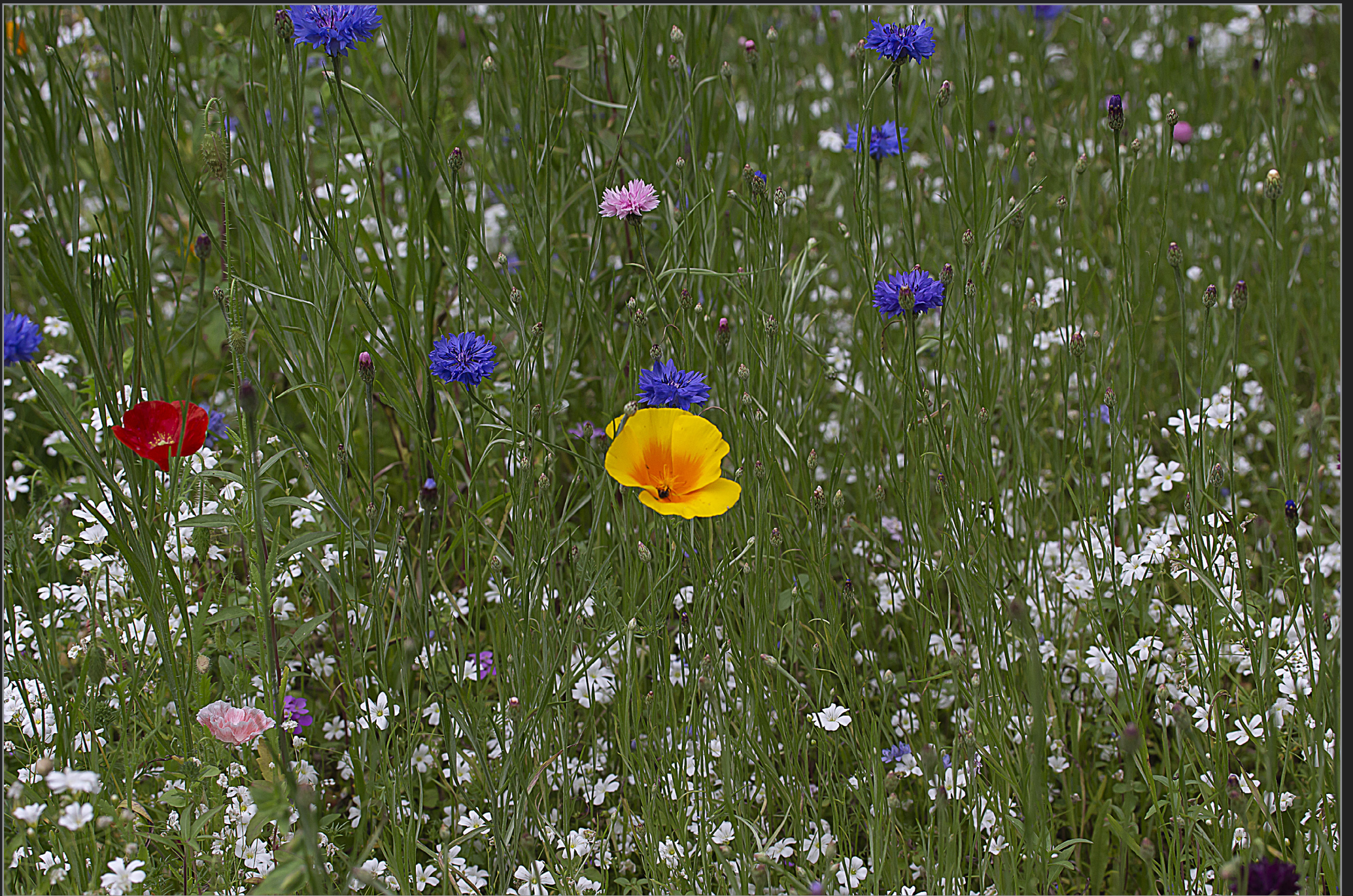
Sønder Kongerslev, juli 2022