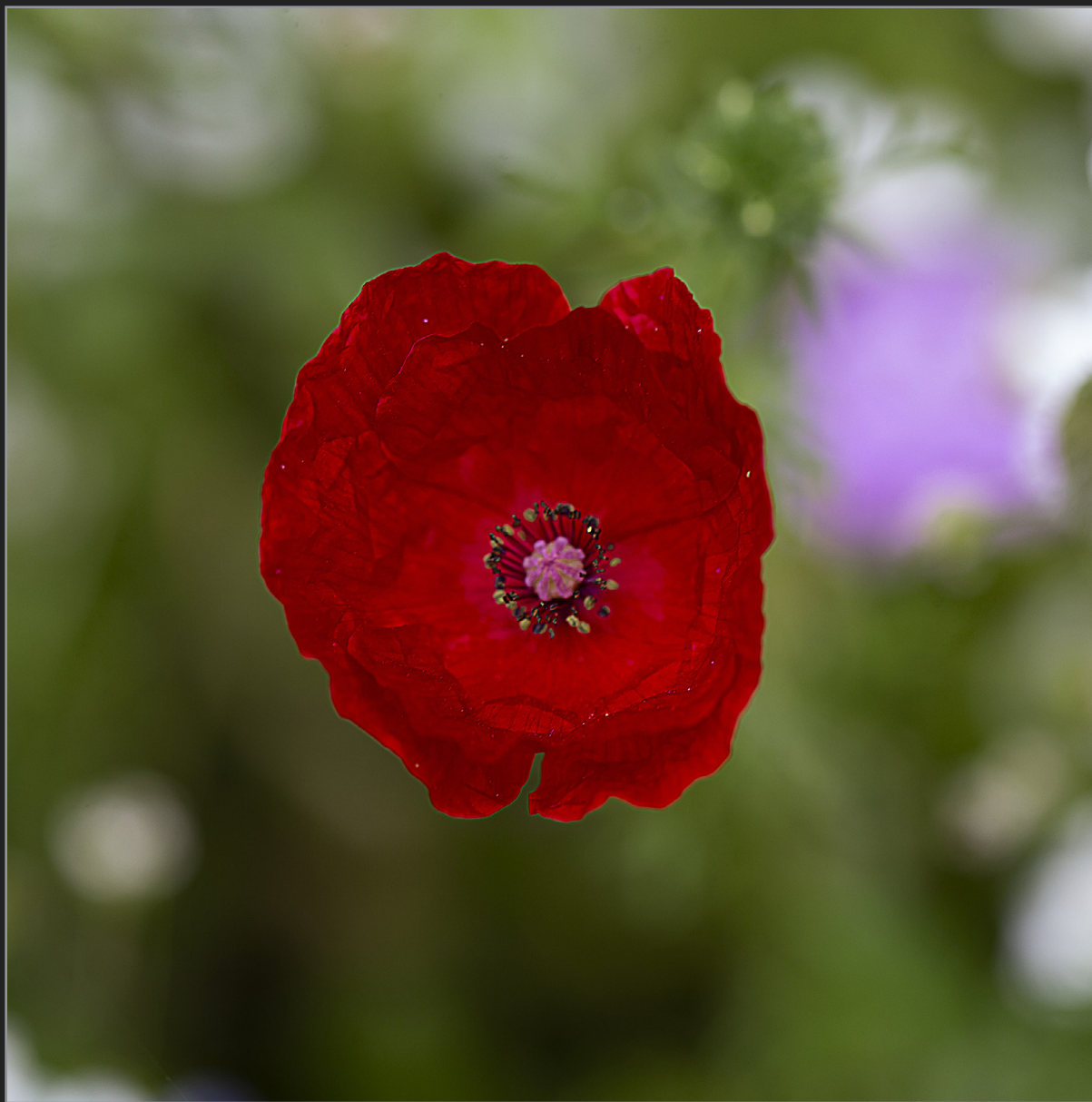
Sønder Kongerslev, juli 2022