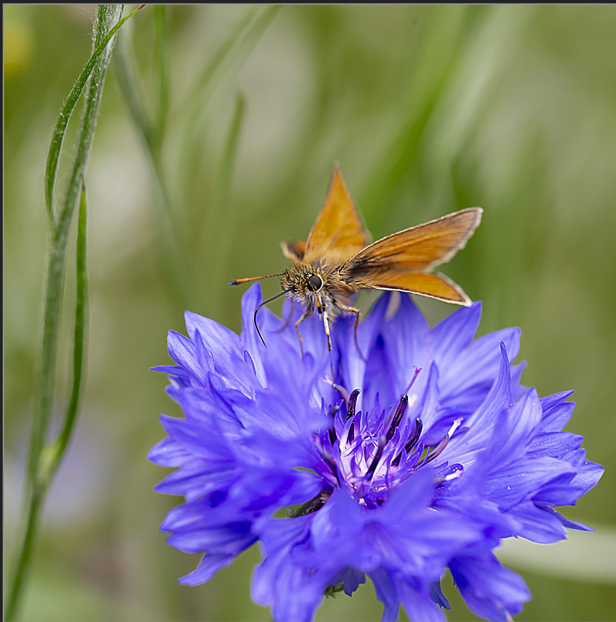
Sønder Kongerslev, juli 2022