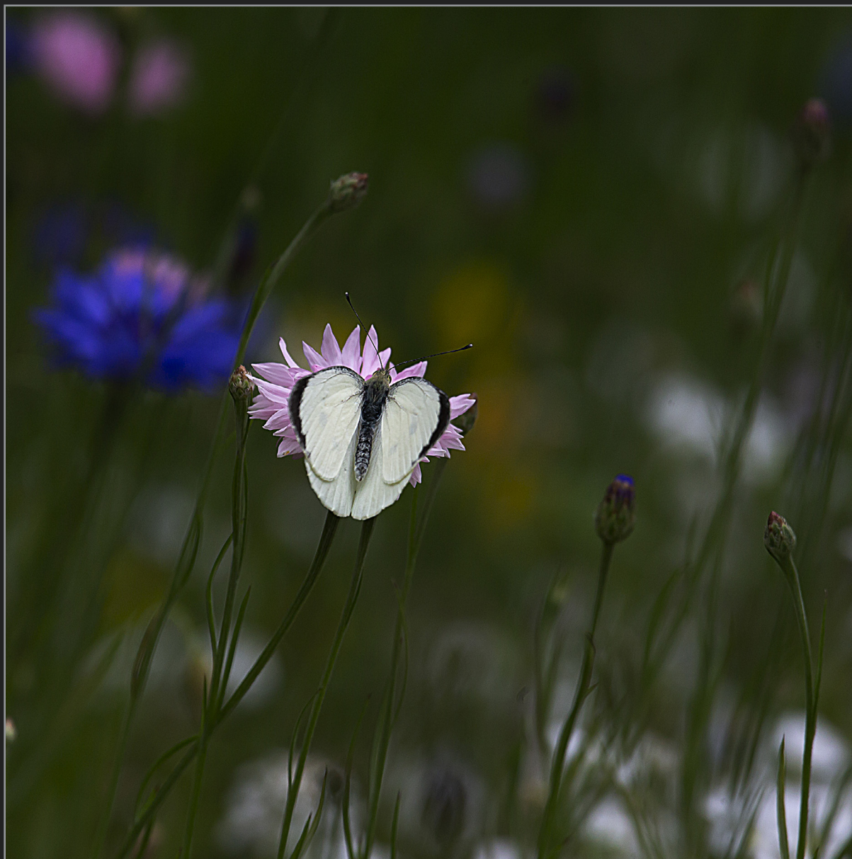
Sønder Kongerslev, juli 2022