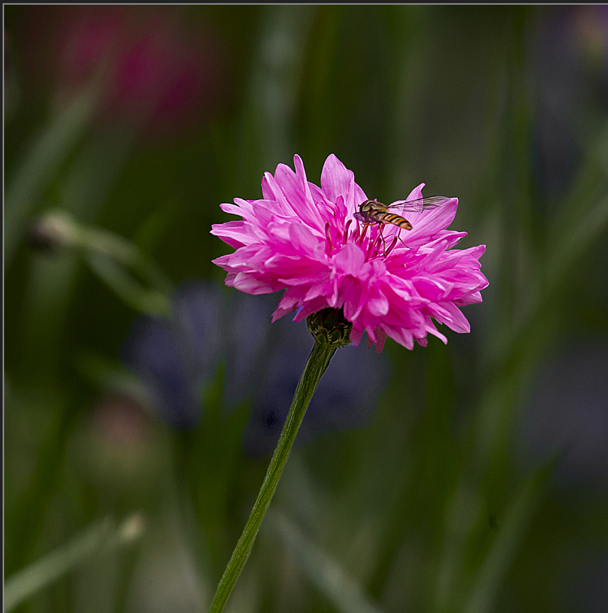
Sønder Kongerslev, juli 2022