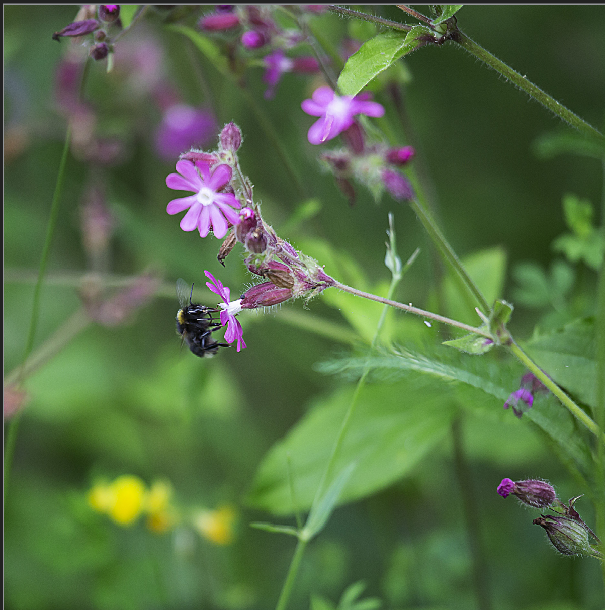
Sønder Kongerslev, juli 2022